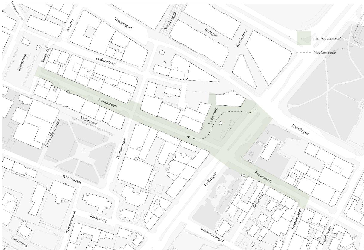
Mynd 1. Kort sem sýnir samkeppnissvæðið

Afmörkun samkeppnissvæðis nær yfir Lækjartorg, Lækjargötu frá Hverfisgötu að Austurstræti, Austurstræti frá Lækjargötu að Ingólfstorgi og Bankastræti frá Þinghóltsstræti að Austurstræti.