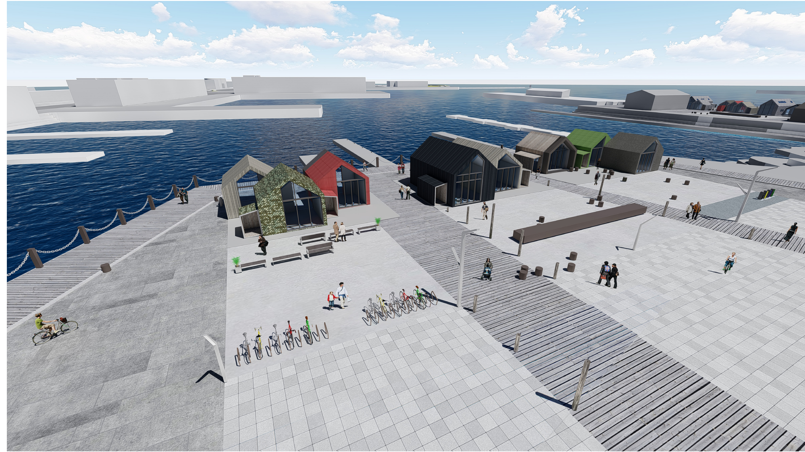
REITUR 05 - HORFT YFIR TORG