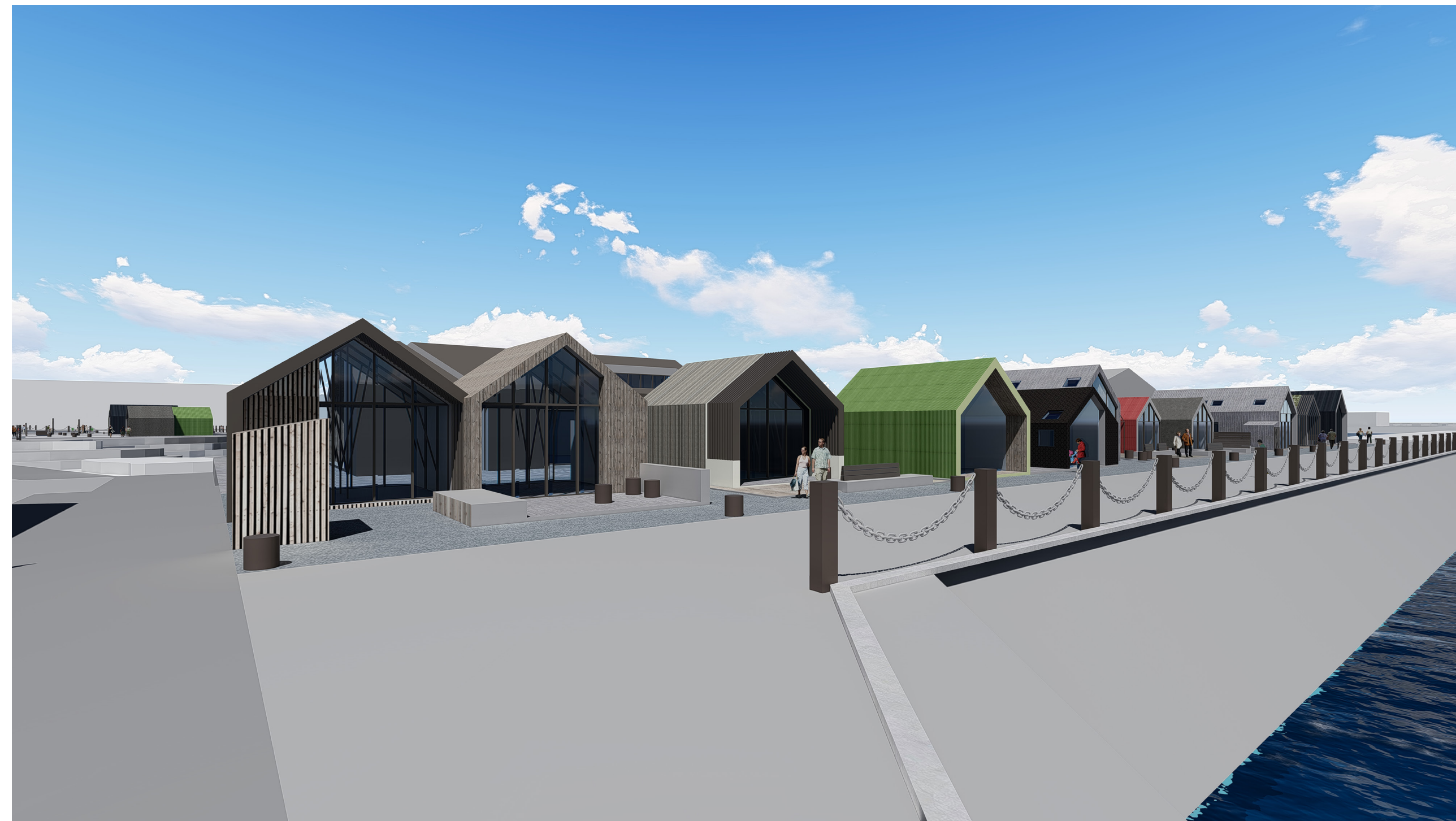
REITUR 06 - HORFT EFTIR GÖNGULÍNU