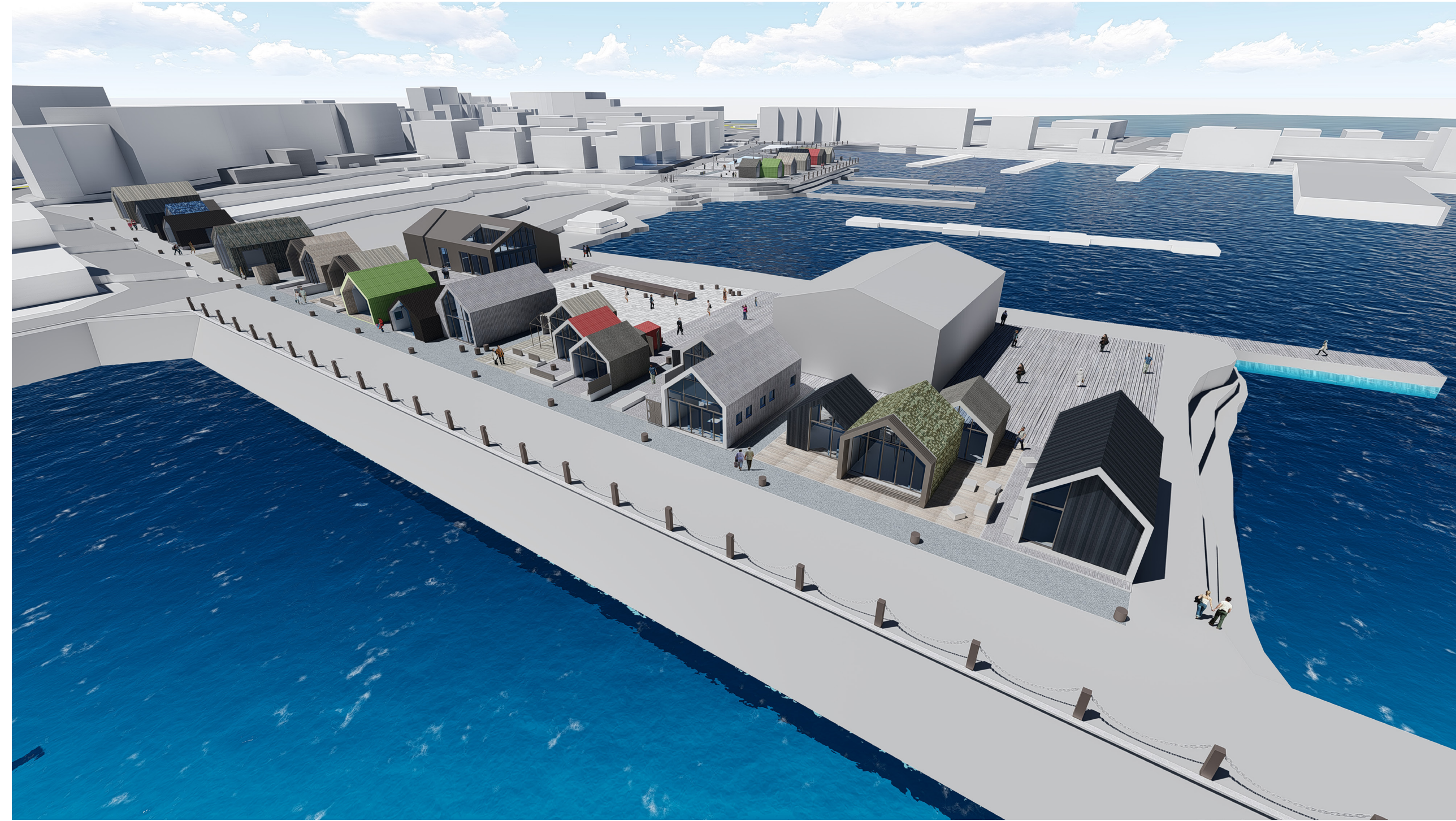
REITUR 06 - HORFT YFIR HAFNARSVÆÐI MED VESTURBUGT (REIT 05) Í BAKGRUNNI