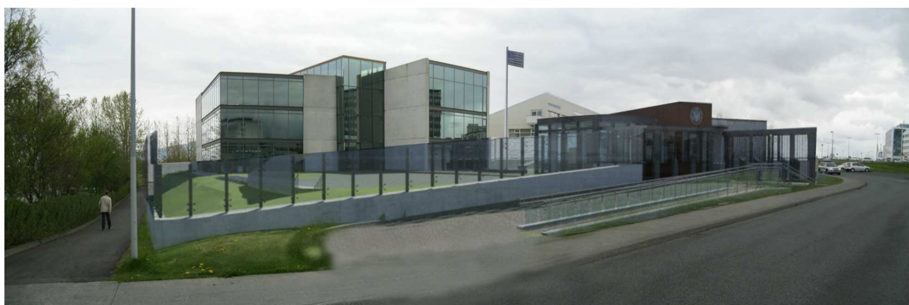
Skýringarmynd ásynd frá Engjateigi

Tillaga að breytingu á deiliskipulagi vegna Engjateigs 7. Mkv. 1:1000