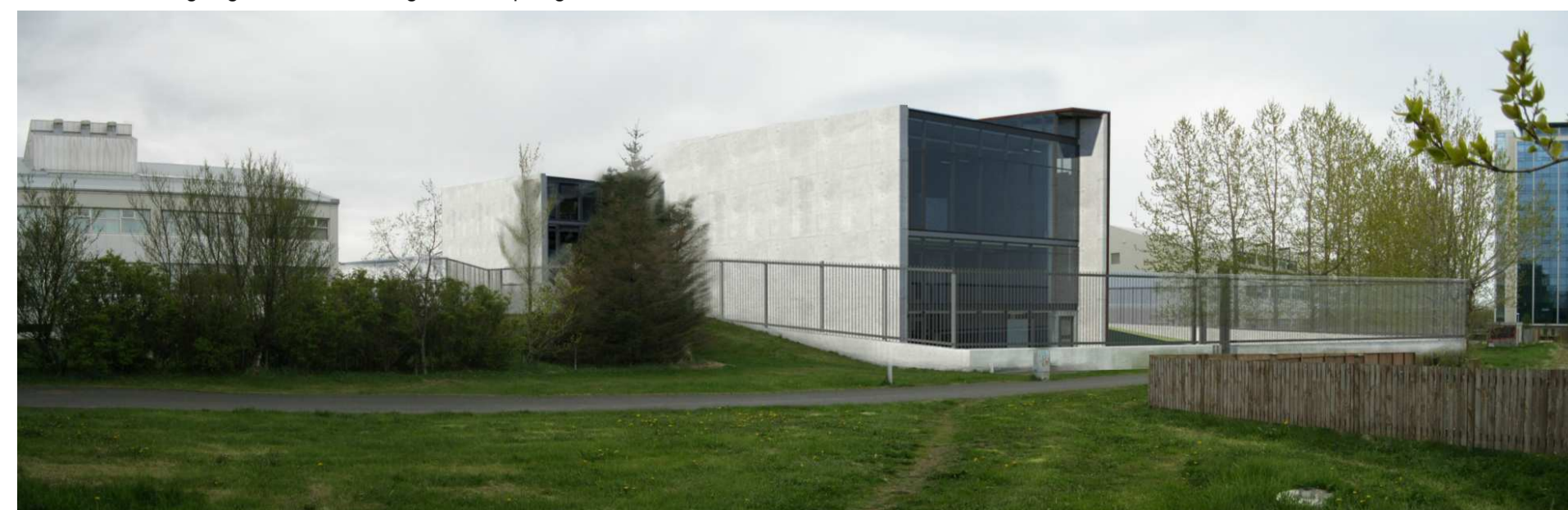
Skýringarmynd ásynd frá stig norðan við löðina

Misræmi í samlagningu helstu stærða í gildandi skipulagi er leiðrétt.