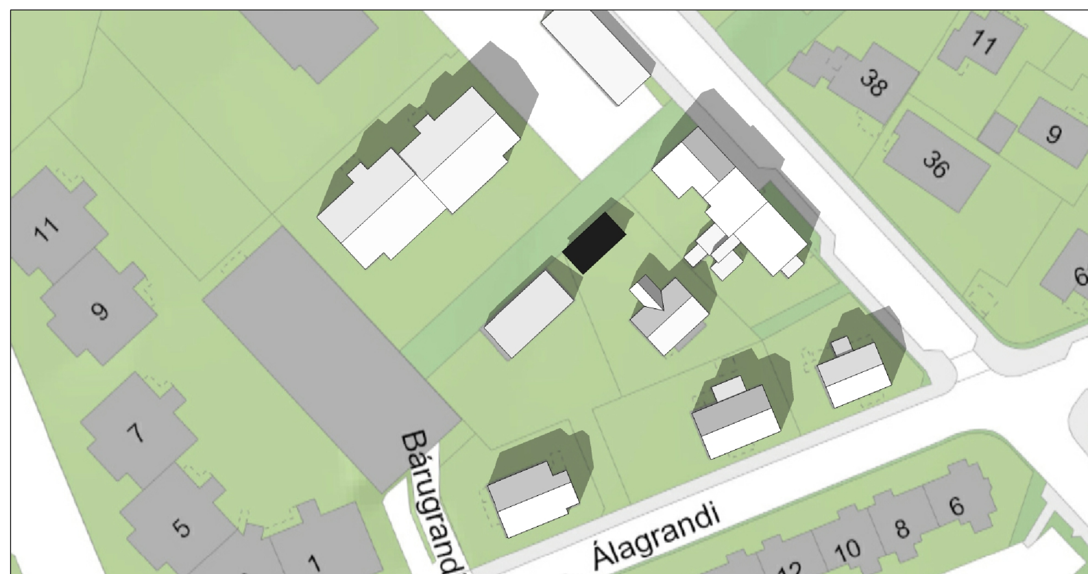
Skuggavarp 21. júní kl. 13.30