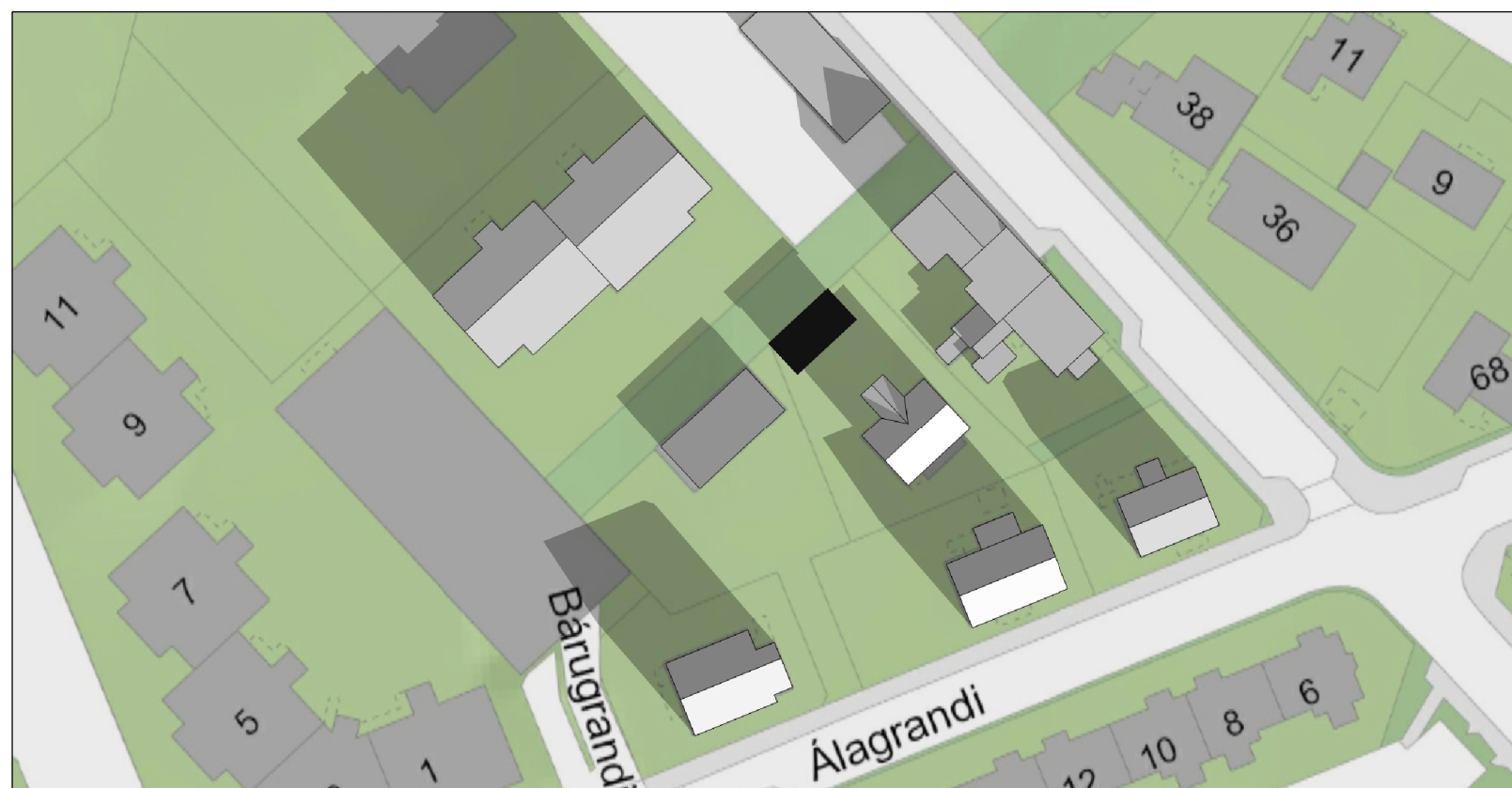
Skuggavarp 20. mars og 22. sept. kl. 10