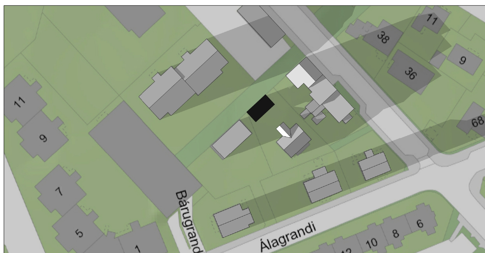
Skuggavarp 20. mars og 22. sept. kl. 17