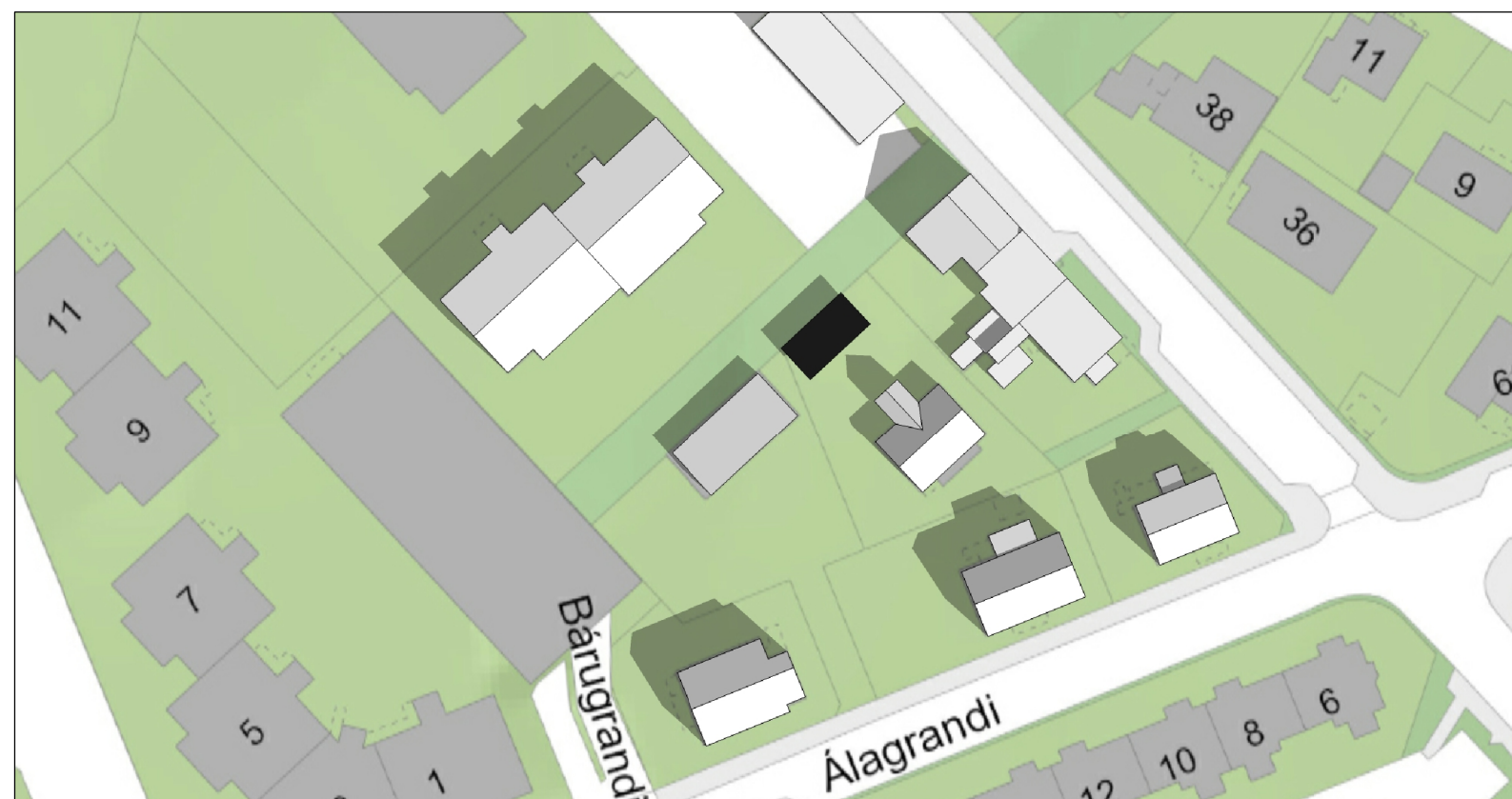
Skuggavarp 21. júní kl. 10