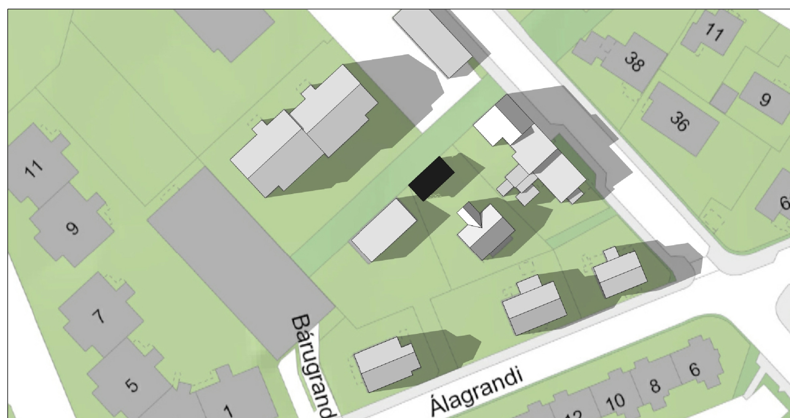
Skuggavarp 21. júní kl. 17

ASK ARKITEKTAR EHF GEIRSGÖTU 9 101 REYKJAVÍK SÍMI 515 0300 FAX 515 0319 www.ask.is