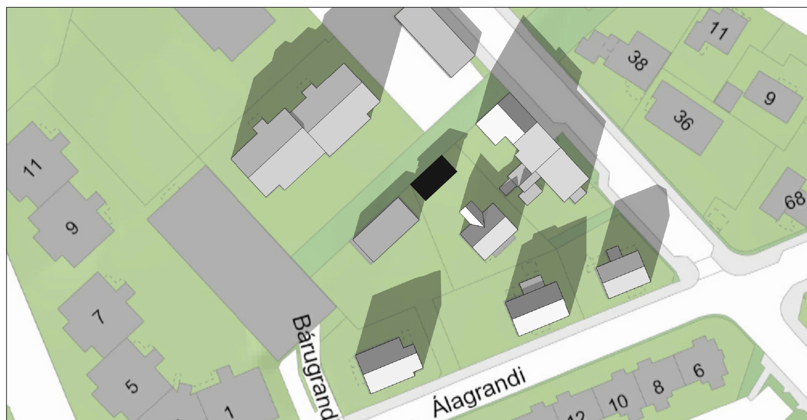
Skuggavarp 20. mars og 22. sept. kl. 13.30