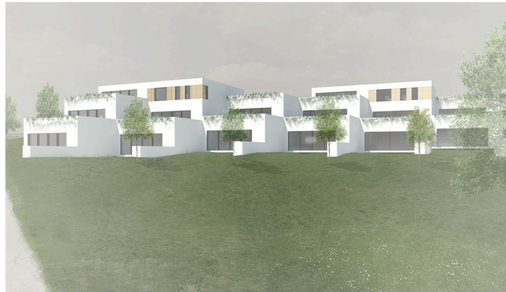
DÆMI UM MÖGULEGA UPPBYGGINGU - SUÐURHLÍÐ

BREYTING A. 26.04.2017: Lóð við Fossvoðsveg hefur verið stækkuð um 2 metra til suðurs og byggingar að sama skapi færðar um 2 metra til suðurs og 0.5 m til austurs þannig að bílastæðiplón fyrir framan húsin lengist um 2 metra. Þannig fest betri nýling á bílastæðiplónum fyrir gestastæði og meira öryggi þar sem bílar færast fær gangstétt. Svo hægt sé að hlíðra til lóðinni og byggingunum svo vel verði þá er gangstígur við Fossvoðsveg færður um 1 metra í átt að norð-austur horni deiliskipulagssvæðis. Við stækun lóðar þá breytist nýtingarhlutfallið úr því að vera 0.75 í það að vera 0.7. Jafnframt er bætt inn í greinargerð undir kafla 2.4 þær úrbætur í umferðarmálum sem lagt er til að verði gerðar samhliða uppbyggingu á svæðinu í kjölfar samþykks deiliskipulagsins.