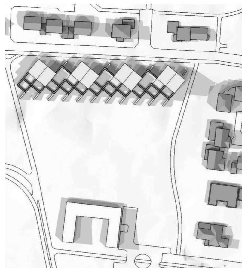
SUMARSÓLSTOÐUR // KL 10.00 - 13.30 - 16.00 - 18.00