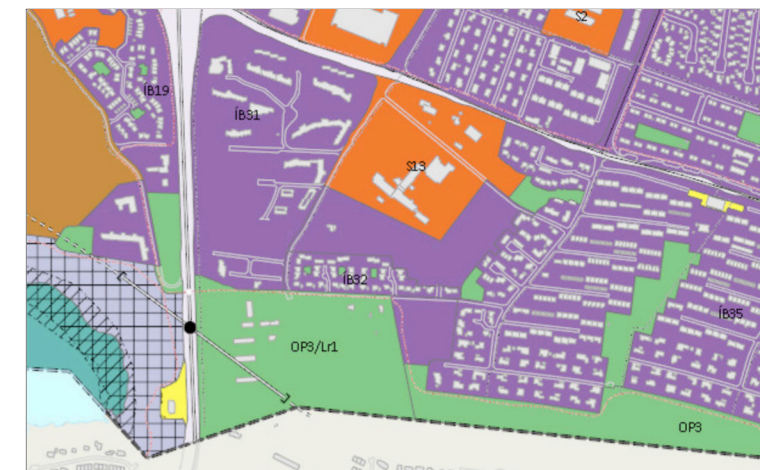
ÚRDRÁTTUR ÚR ADALSKIPULAGI REYKJAVÍKUR 2010-2030