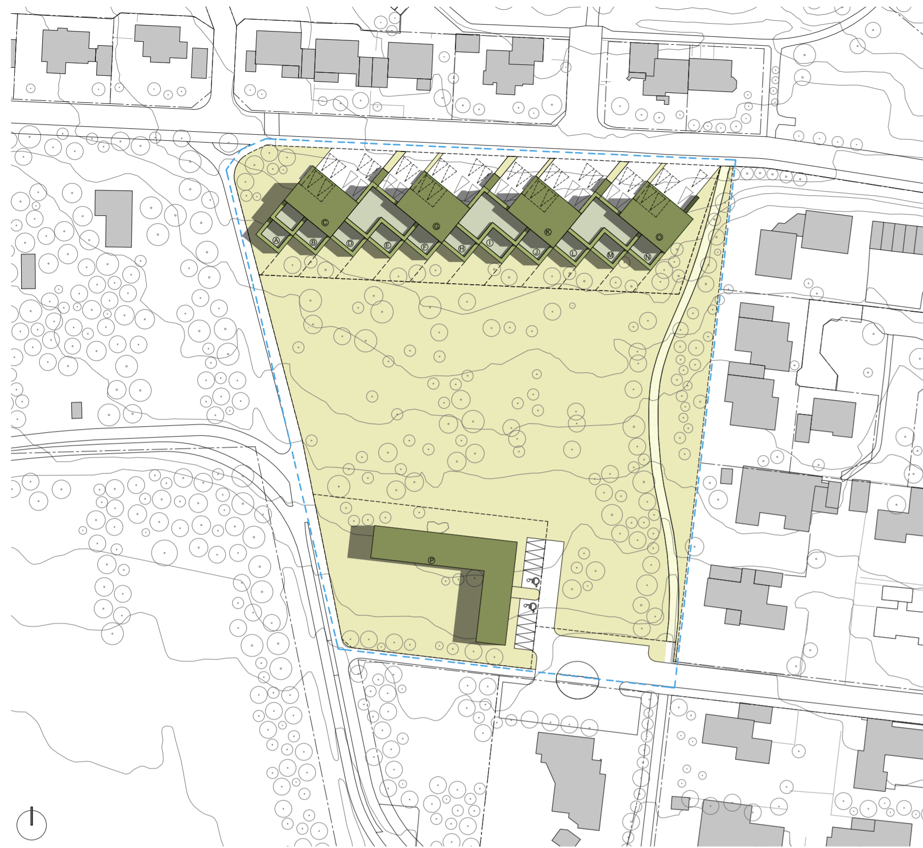
MKV 1:1000, DÆMI UM MÖGULEGA UPPBYGGING