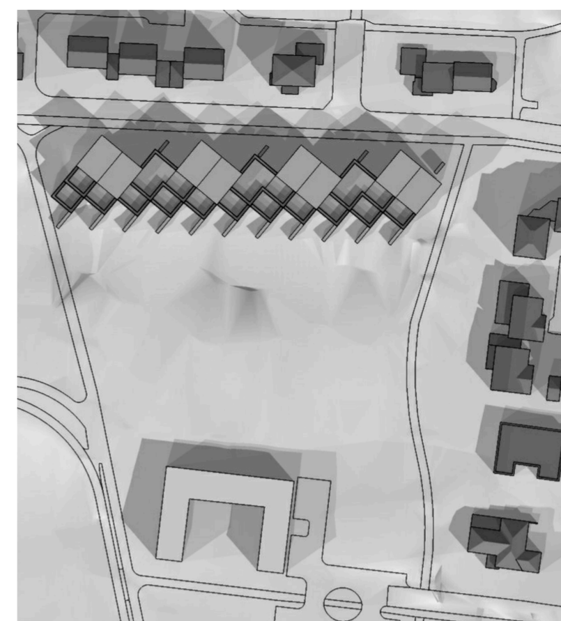
JAFNDÆGUR // KL 10.00 - 13.30 - 16.00 - 18.00