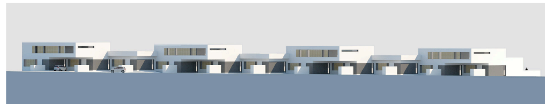
MKV 1:500, DÆMI UM ÚTLIT NORÐURHLÍÐ FOSSVOGSVEGUR