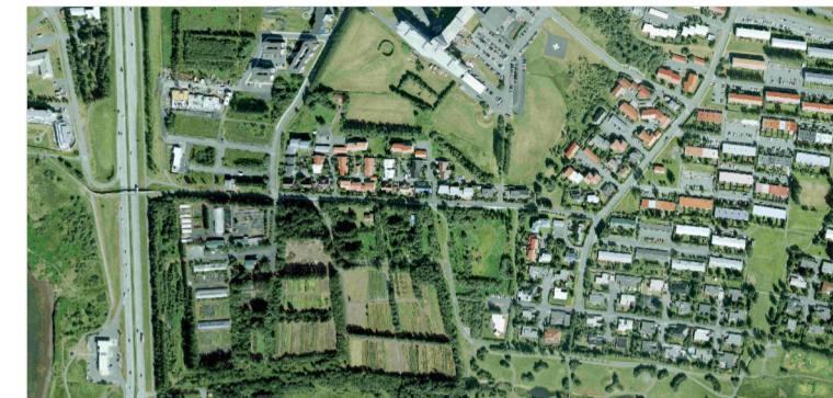
ÚR LOFTMYND FRÁ 2015