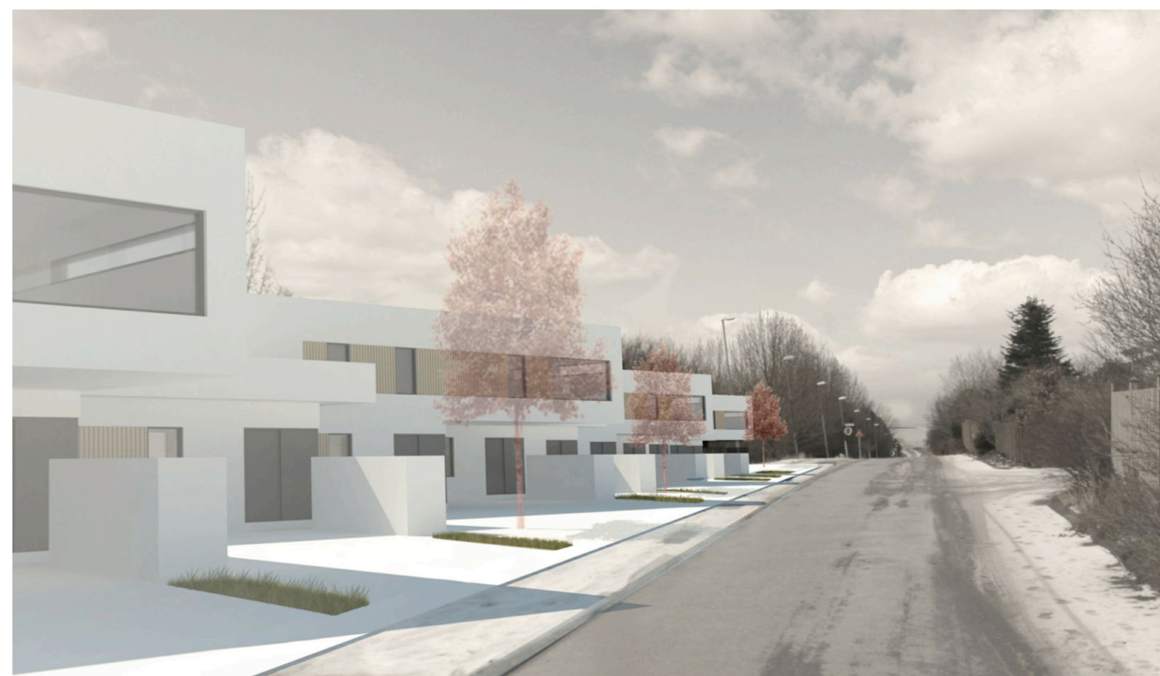
DÆMI UM MÖGULEGA UPPBYGGING VÍÐ FOSSVOGSVEG