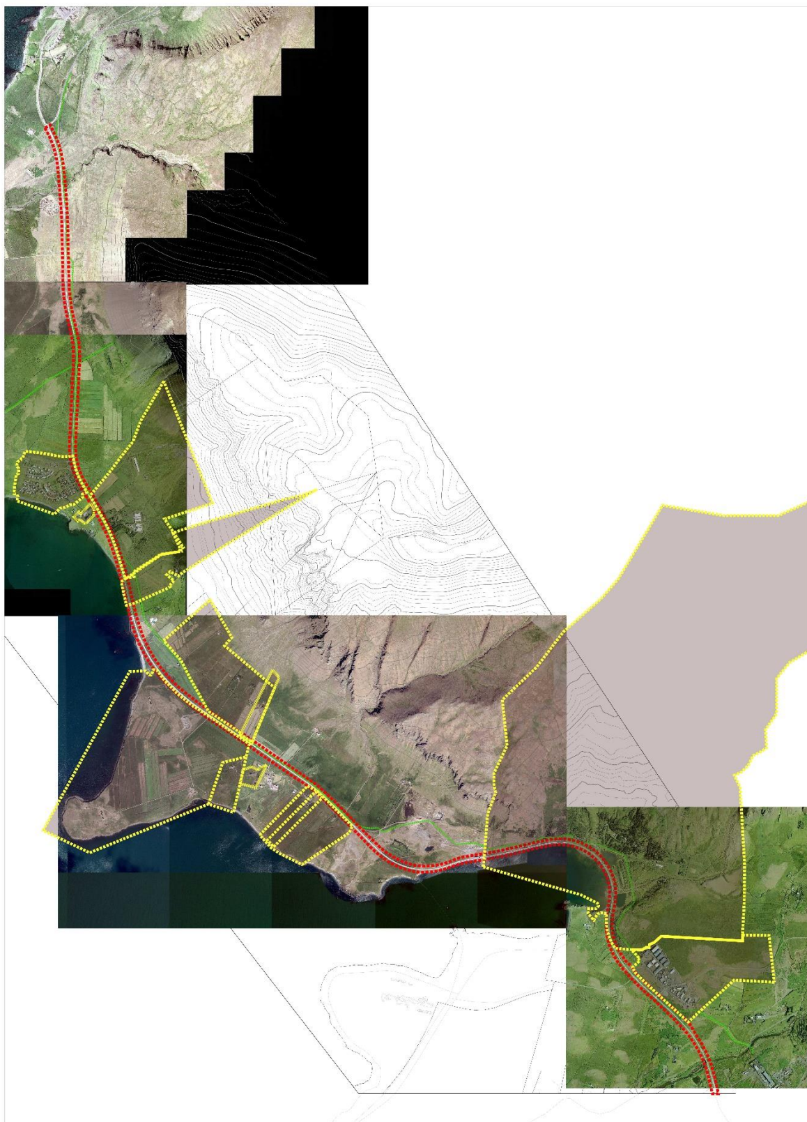
Mynd 4 Aðliggjandi deiliskipulagsáætlanir