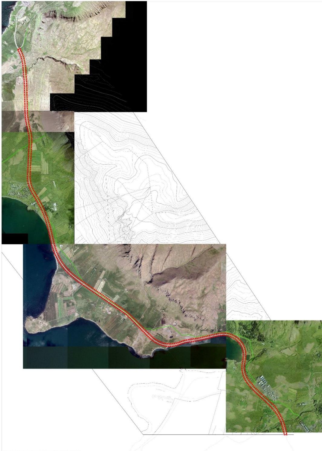
Mynd 2 Áætluð afmörkun skipulagssvæðisins