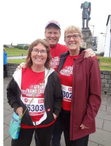
Plúsarar í Reykjavíkurmaraþoninu

✓ Heildarþátttakendafjöldi SP 2003-2016: 178