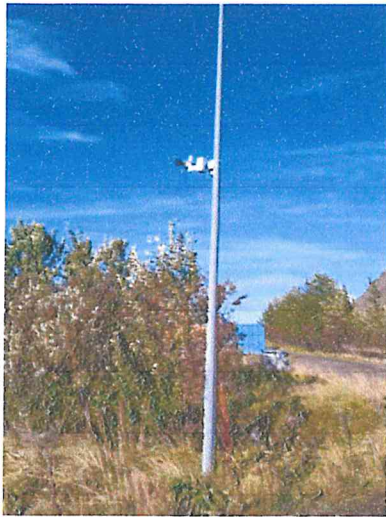
Mynd 11 sýnir SP4 hljóðmæli uppsettan við Skriðu og Stekk