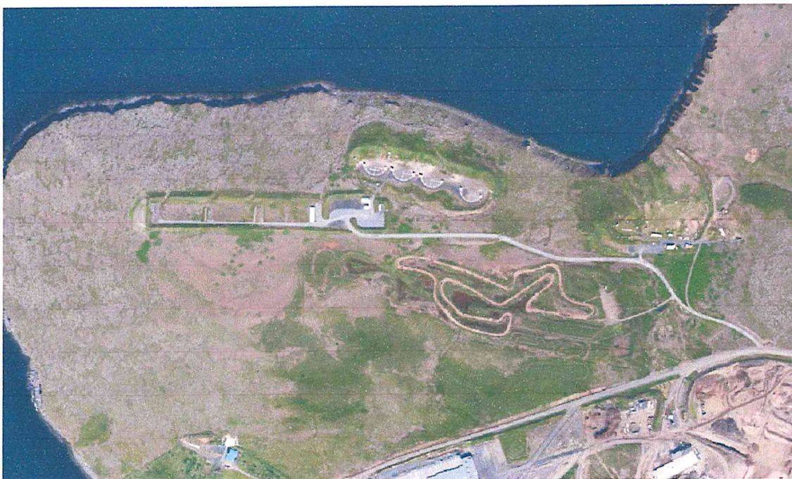
Núverandi aðstæður skotsvæðisins á Álfsnesi, mynd tekin 2020.

Skotveiðifélag Reykjavíkur hefur haft svæðið sem um ræðir til tímabundinna afnota undanfarin ár og hafa íbúar í nágrenni svæðisins látið í ljós óánægju sína með hávaða o.fl. frá æfingasvæðinu árum saman. Í ljósi þeirra ábendinga sem borist hafa og þeirrar óánægju sem ríkt hefur með núverandi staðsetningu svæðisins telur skipulagsfulltrúi nauðsynlegt að setja strangari skilyrði um starfsemina s.s. opnunartíma og notkun á blýhöggjum samhliða því að kanna til hlítar aðrar staðsetningar fyrir starfsemina á höfuðborgarsvæðinu með það að markmiði að finna varanlegri aðstöðu fyrri skotæfingar á höfuðborgarsvæðinu.