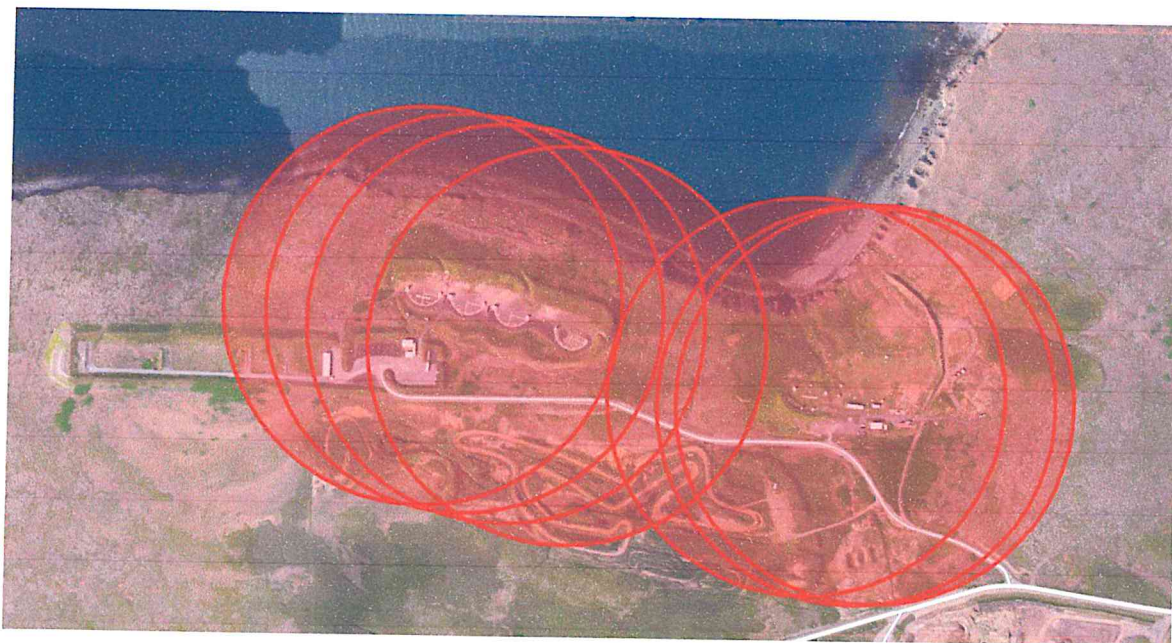
Mynd 4 sýnir drægni haglaskota ef miðað er við 250 m radius

Þegar áætlaður fjöldi hagla á fermetra (m 2 ) er skoðaður fyrir bæði svæðin sést að talsvert magn af höglum er að finna í jarðveginum við skotsvæðin en það var ekki óviðbúið. Greinilegur munur er á áætluðum fjölda hagla á fermetra (m 2 ) milli skotsvæða. Rétt er að taka fram að aðstæður eru mismunandi milli skotsvæða og er að jarðvegsmön sem er við skotvöll Skotfélags Reykjavíkur (SR) taki stóran hluta af höglum sem þaðan berst. Við skotsvæði Skotveiðifélags Reykjavíkur (Skotreyrn) er engin slík jarðvegsmön og sýnatökustaðir í beinni sjónlínu við skotsvæðið.