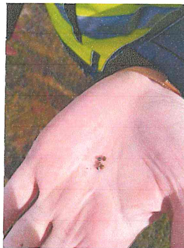
Mynd 1 sýnir dæmi um opinn jarðveg á svæðinu með greinilegum höglum á yfirborði