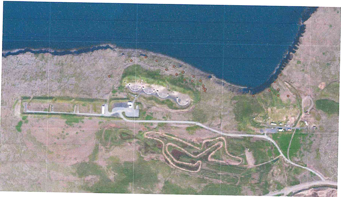
Mynd 2 er yfirlitsmynd fyrir bæði skotsvæði. Vinstra megin er skotsvæði Skotfélags Reykjavíkur og hægra megin er skotsvæði Skotveiðifélags Reykjavíkur. Sýnatökustaðir þar sem högl voru talin eru merktir með brúnum punkti.