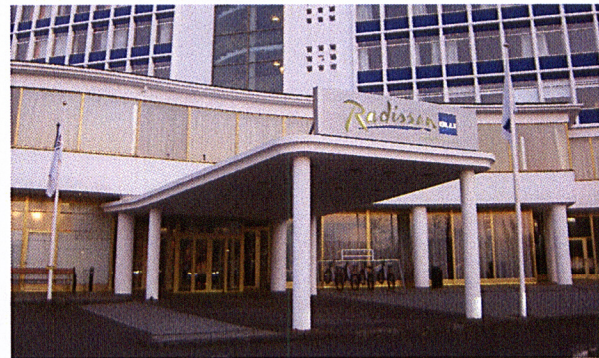
Gestahjól við Hótel Sögu