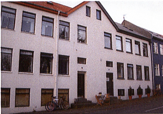
Gestinn við Njarðargötu – gestahjól í forgrunni