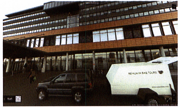
Hótel Nordica