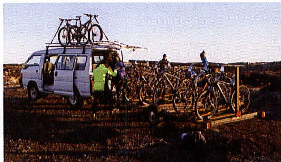
Ýmiskonar afþreying er í boði fyrir bíllausa ferðamenn