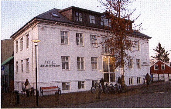
Hjólástæði fyrir utan Hótel Leifur Eiríksson