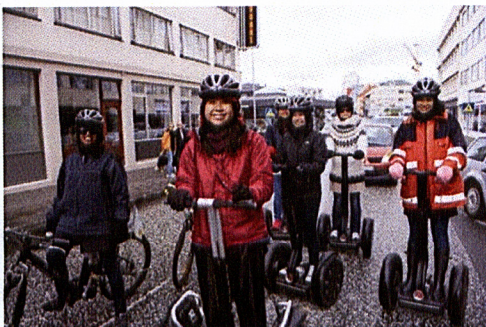
Ferðamenn í Reykjavík

Nægum hjólastæðum fyrir gesti og starfsfólk verður komið fyrir á lóðinni. Á lóðinni eru 17 bílastæði, þar af eitt fyrir hreyfihamlaða. Í göturými Rauðarárstígs fyrir framan Laugaveg 120 eru 7 gjaldskyld bílastæði á borgarlandi og einnig eru gjaldskyld stæði í Þverholti og Stórholti. Næsta bílastæðahús Bílastæðasjóðs er Stjörnuport á Laugavegi 94.