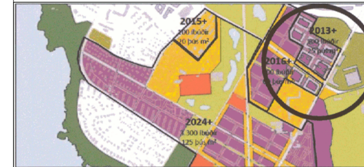
ADALSKIPULAG REYKJAVÍKUR 2010-2030

Aðalskipulagi er breytt samhlíða deiliskipulagsbreytingunni.