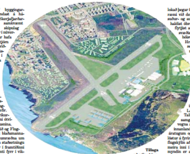
Tillaga að nýju skipu-

Samgönguráðgjafi og Flugmálastjórn höfðu til blaðamannafundar í gær vegna umræðna um þær fimm tillögur um staðsetningu Reykjavíkflugvallar í framtíðinni sem borgarstjórn kynnti fyrr í vikunni vegna atkvæðisráðs meðal