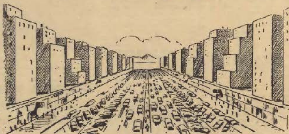
Götumynd í Reykjavík framtíðarlinaar?

VÖXTUR REYKJAVÍKUR Þótt ekki séu líðin nema um hundraf ár, síðan verið byggð lóki að myndast í Reykjavík, þær eldri hlutar bæjarins greiðulega vætt um lítill eða ekkert skipulag í byrjun. Og síðan hefur það orðið hlutskipt Reykjavíkur, eins og flestra annarra borga, að myndast smám saman, án þess að nokkru sinni væri framsýni og fjárnagur fyrir hendi, til að gera stórfelldar áætlanir fram í tíðina, ásamt nauðsynlegum byrjunarframskráningum. Á síðari árum hafa þessi máli verið tekið öðrum tókum en áður var. Og vart er hægt að áfellaast forræðsmenn þanna 2500 Reykvikingsa árið 1880, eða þá, sem réðu fyrir máltum hinna 11.800 bæjarbúa árið 1910, þótt þá vændi ekki grun í, að í árbyrjun 1956 yrðu Reykvikingsar orðnar 84.000, og 9.000 bíféðir yrðu í þennum. Gera varður ráð fyrir, að Reykjavík og Hafnarfjörður hafi fullkomlega byggst saman um næstu aldamót, m. a. með veru-