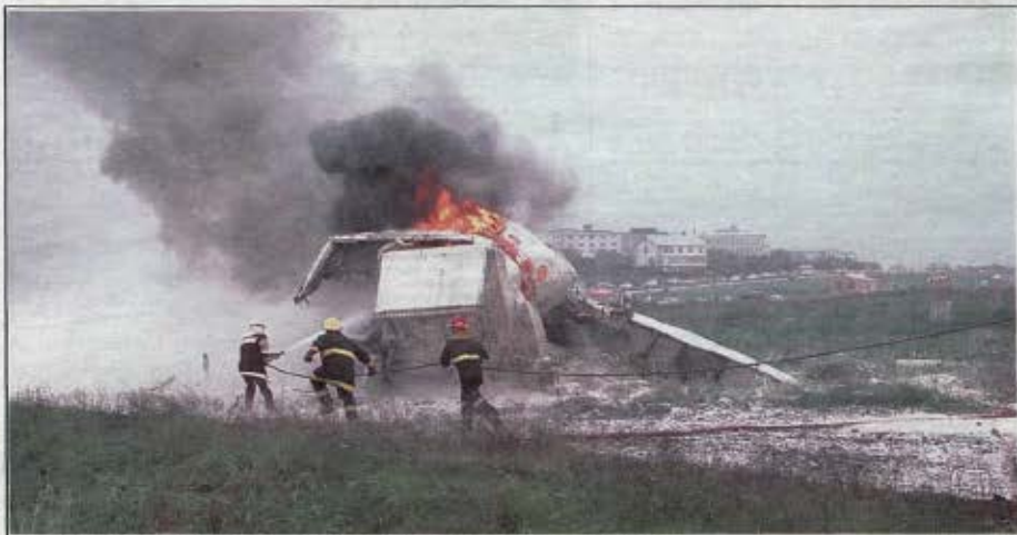
Síðkvíðanessan berjat við eldinn aðeins þremur mínútum eftir sprenginguna. Brandarþóla eru til hægri á myndinni.