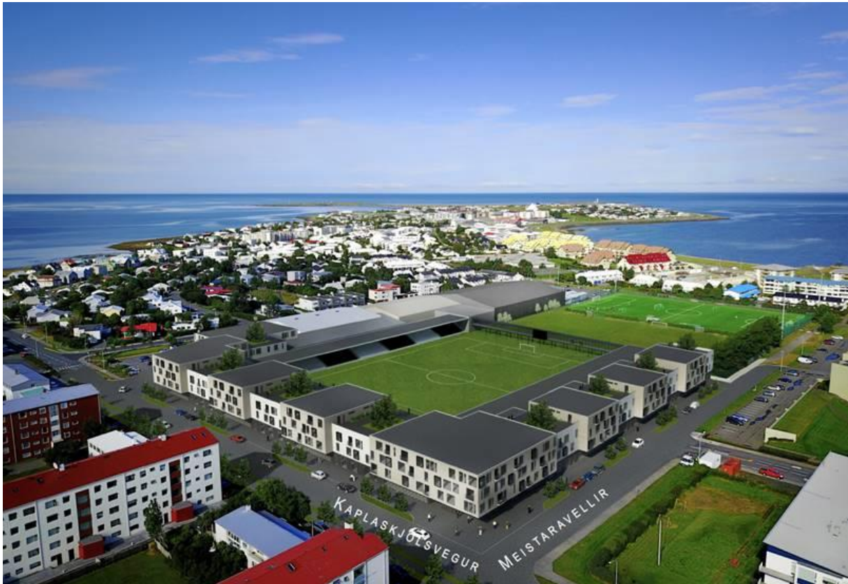
Mynd 1: Möguleg uppbygging á svæðinu, samkvæmt teikningum sem unnar hafa verið fyrir íþróttafélagið (Bjarni Snæbjörnsson & Páll Gunnlaugsson)

Frekari uppbygging á íþrótt- og tólmundastarfi KR stendur fyrir dyrum á svæði félagsins við Frostaskjól. Í tengslum við þá uppbyggingu og endurbætur á íþróttasvæðinu, hefur verið hugað að því stuðla að fjölbreyttari landnotkun á svæðinu. Það hefur einkum verið skoðað í samhengi við byggingu nýrrar áhorfandastúka við aðal keppnisvöll félagsins, á móts við annars vegar Kaplaskjólsvæg og Flyðrugranda hinsvegar. Frumteikningar af mögulegri uppbyggingu hafa nú þegar verið kynntar og ræddar á íbúafundum í hverfinu (sjá mynd 1).