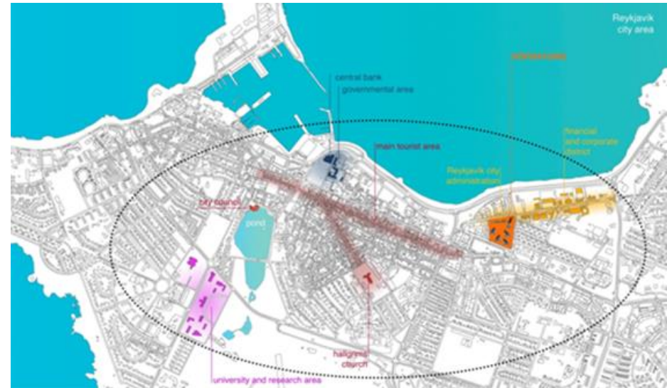
H-in 4: Höfðatorg, Harpa, Háskólasamfélagið, Hallgrímskirkja