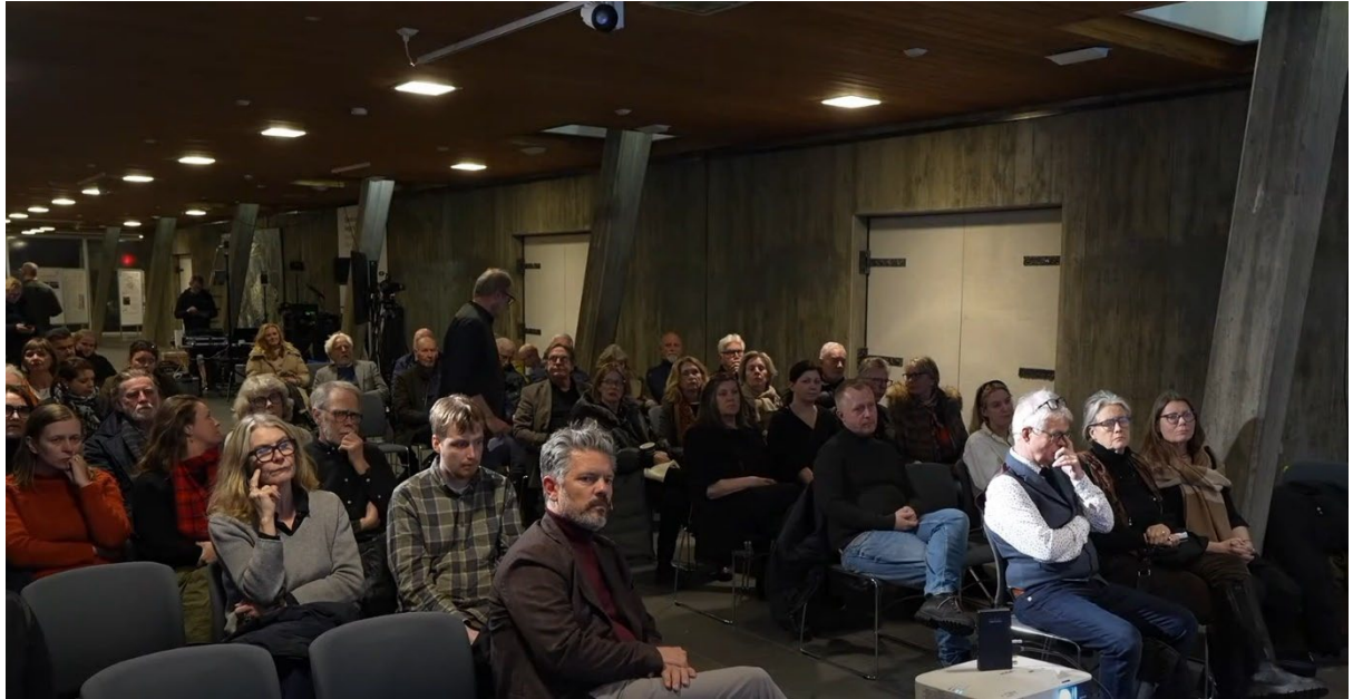
Íbúafundur borgarstjóra á Kjarvalsstöðum 21. nóvember 2023.