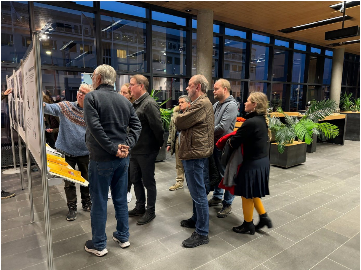
Leiðsögn á sýningu í Borgartúni 12–14, 10. janúar 2024.