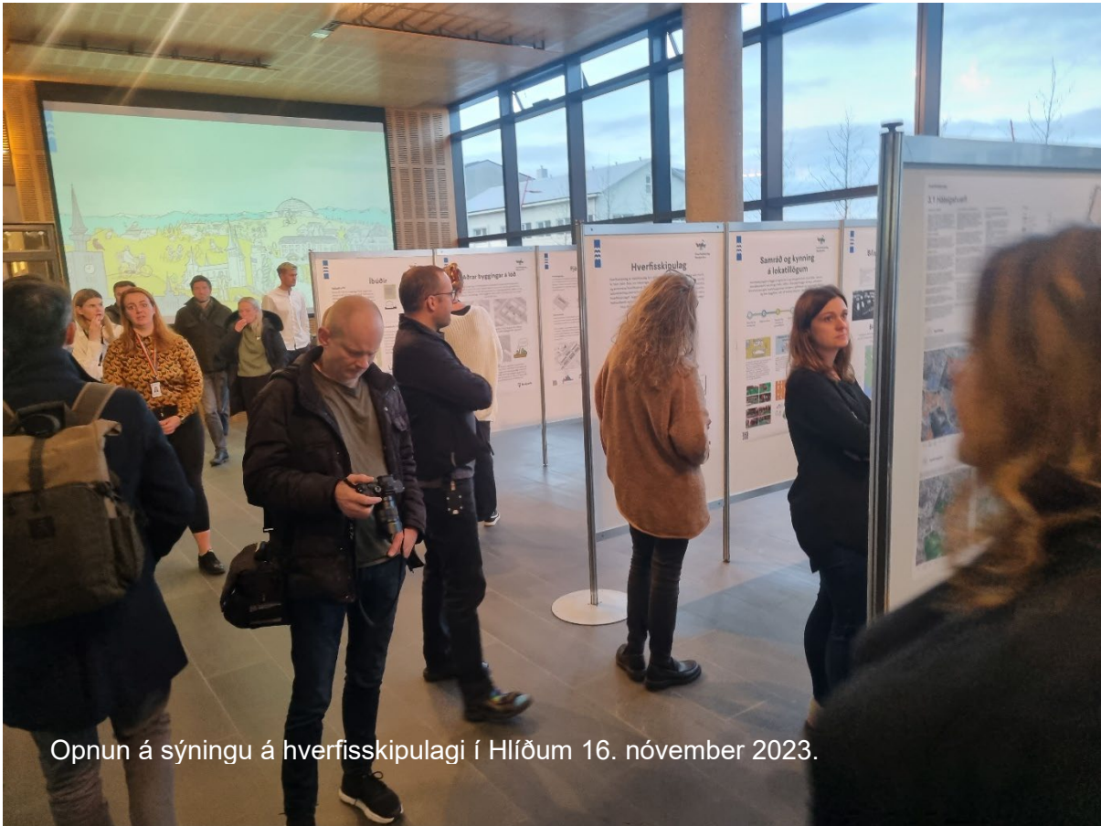
Opnun á sýningu á hverfisskipulagi í Hlíðum 16. nóvember 2023.