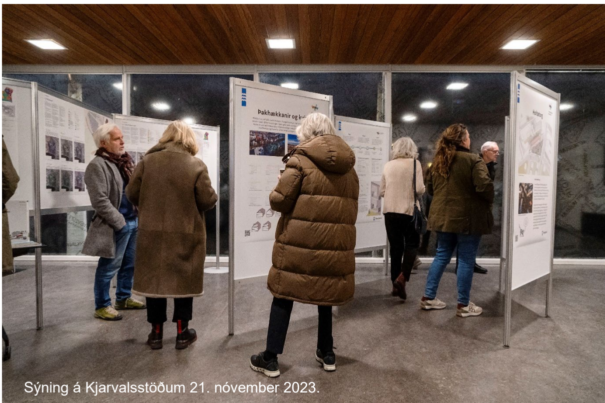
Sýning á Kjarvalsstöðum 21. nóvember 2023.