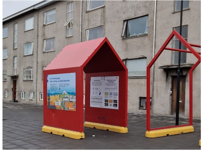
Rauðu húsin sem staðsett voru á Klambartúni og Hlemmi með kynningarefni um hverfisskipulag í borgarluta 3 á tímabilinu 16. nóvember 2023 til 1. febrúar 2024.