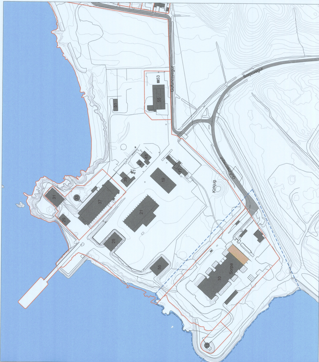
TILLAGA AÐ BREYTINGU Á DEILISKIPULAGI