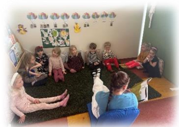
Samverustund upp í sal

Síðasta árið hefur Hagaborg verið undir smásjá hvað varðar innivist og með nánari skoðun í vetur kom í ljós að það þurfti að gera töluverðar framkvæmdir á Fiskalandi og því þurfti að loka deildinni tímabundið. Viðgerðir á deildinni drógust töluvert á langinn en deildin var lokuð alveg fram í lok ágúst 2024. Vegna þessara framkvæmda þurfti að skipta upp barnahópnum niður á nokkrar deildir og eins var íþróttasalnum breytt í eina litla deild.