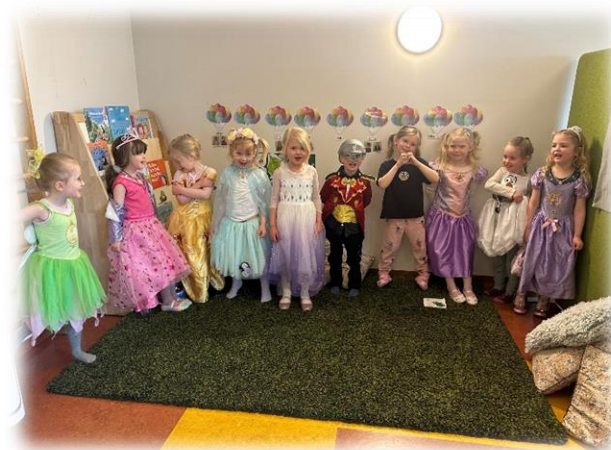
Búningadagur upp í sal 😊

við getum glöð unað eftir veturinn þó það sé alltaf hægt að gera betur en barnahópurinn var almennt ánægður og myndaði sterk félagsleg tengsl sín á milli og foreldrasamstarfið var traust.