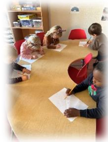
Verkefnavinna í hópastarfi.