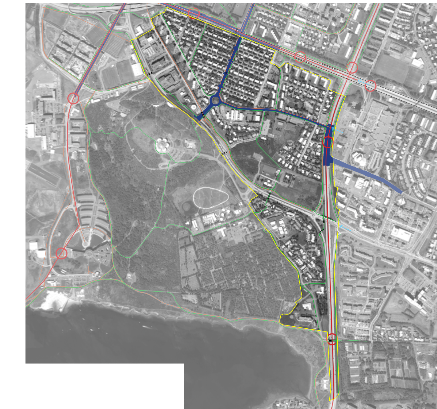
Samgöngur - Aerial map showing transportation infrastructure and zones.

Stærri er að þjónu íbúðum áhrifum stöðublaða sem umlyka hverfið og auka öryggi vegferenda með borgarboðveingju stöðublaða og helstu gæta innan hverfisins. Stærri áhersla er að þjónu áhrifum stöðublaða með hljóla og innviðum miklubrautar og staðaranda. Stærri áhersla er að þjónu áhrifum stöðublaða með hljóla og innviðum miklubrautar og staðaranda. Stærri áhersla er að þjónu áhrifum stöðublaða með hljóla og innviðum miklubrautar og staðaranda.