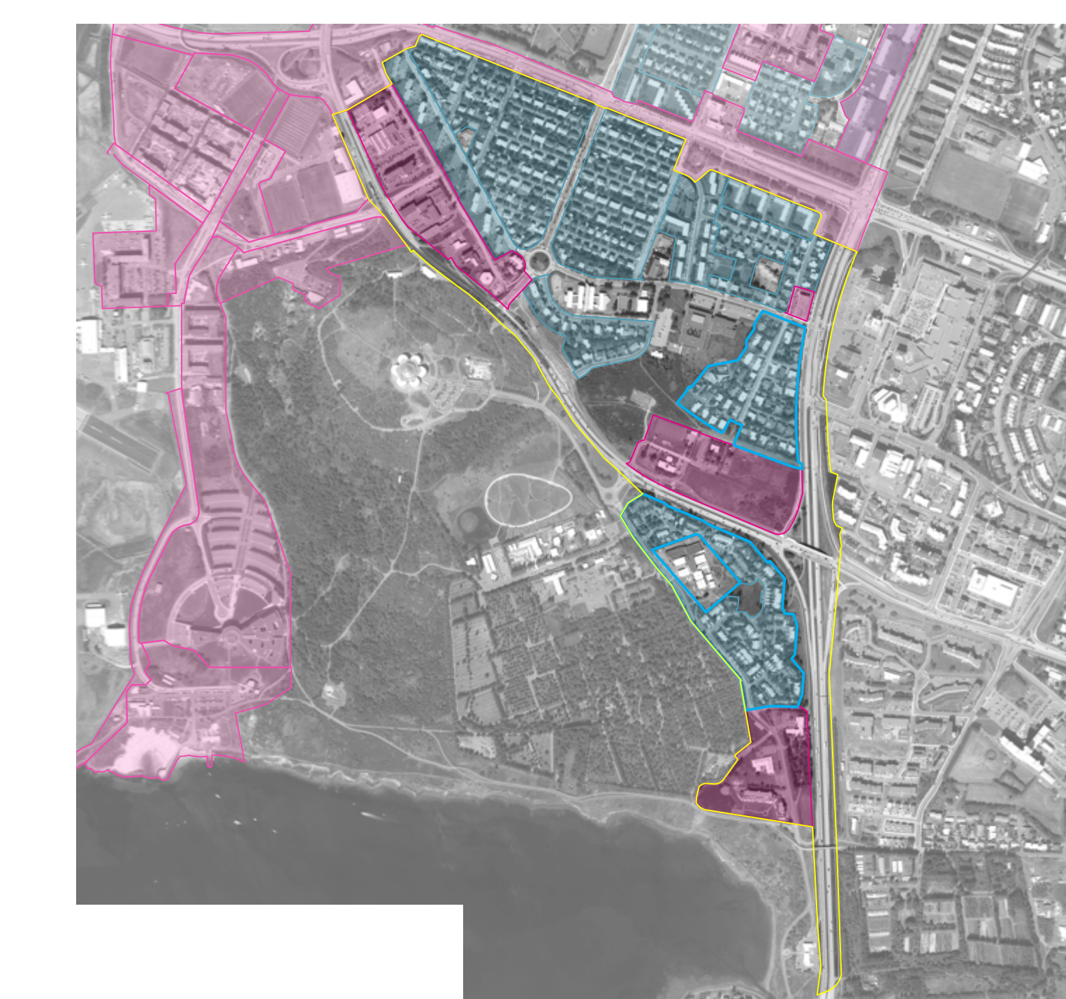
Mannvirki - Aerial map showing human-made structures and zones.

Stærri er að þjónu áhrifum stöðublaða með hljóla og innviðum miklubrautar og staðaranda. Stærri áhersla er að þjónu áhrifum stöðublaða með hljóla og innviðum miklubrautar og staðaranda.