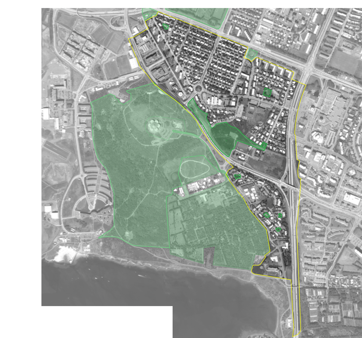
Náttúruvá - Aerial map showing natural hazard zones.

Stærri er að þjónu áhrifum stöðublaða með hljóla og innviðum miklubrautar og staðaranda. Stærri áhersla er að þjónu áhrifum stöðublaða með hljóla og innviðum miklubrautar og staðaranda.