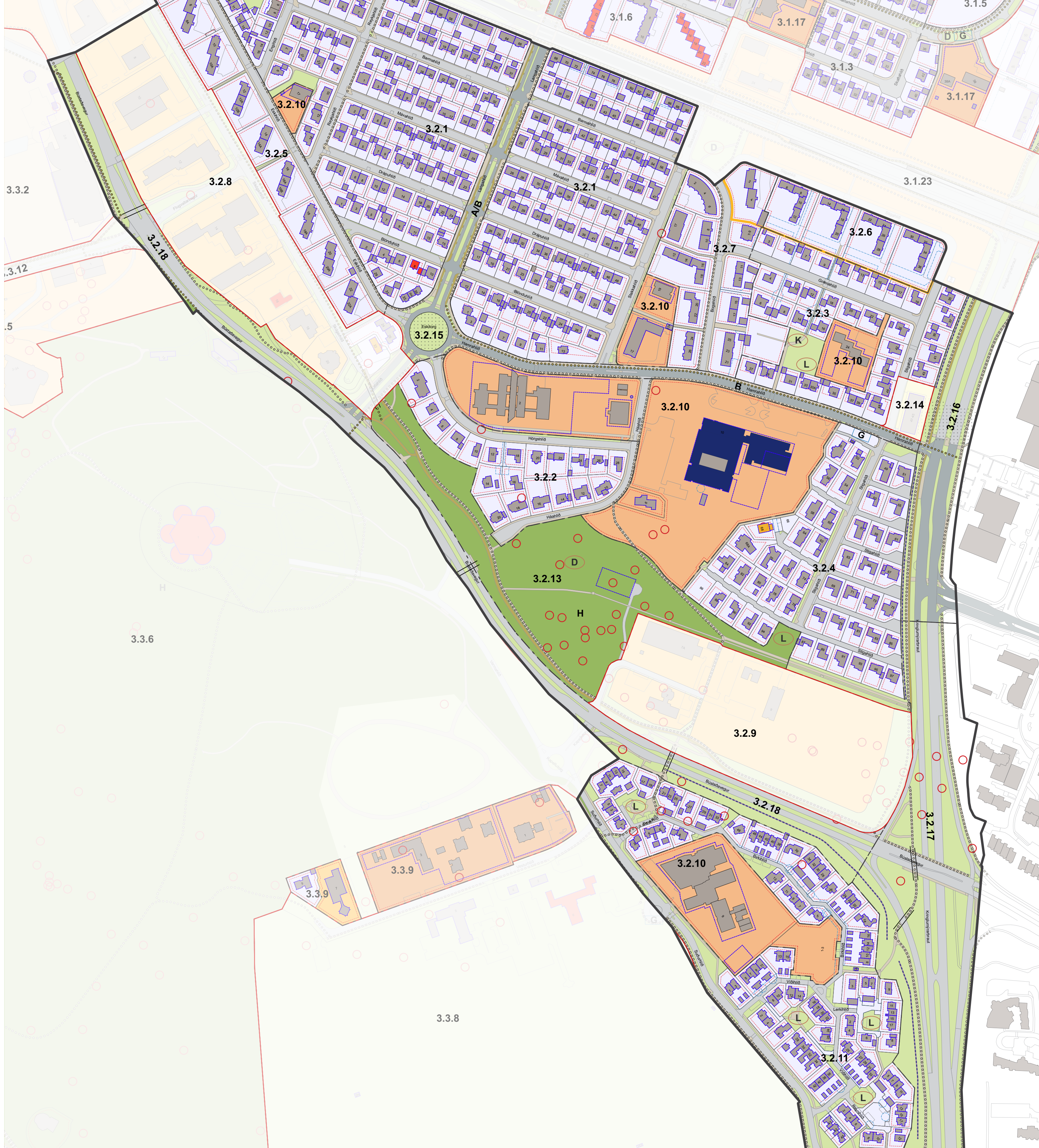
3.2 Hlíðahverfi - Detailed map showing various zones and infrastructure.