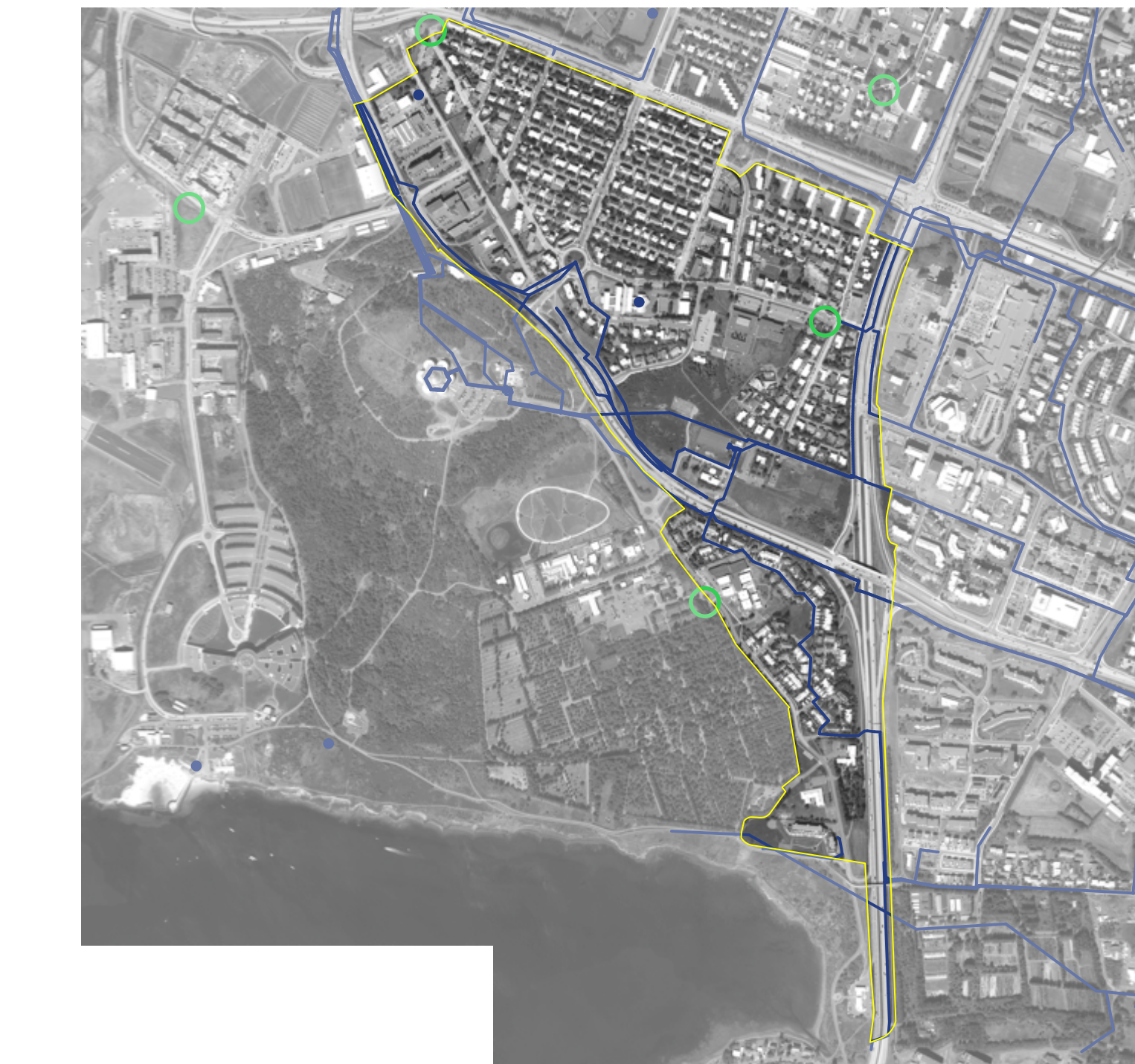
Orka og Auðlindir - Aerial map showing energy and resources zones.

Stærri er að þjónu áhrifum stöðublaða með hljóla og innviðum miklubrautar og staðaranda. Stærri áhersla er að þjónu áhrifum stöðublaða með hljóla og innviðum miklubrautar og staðaranda.