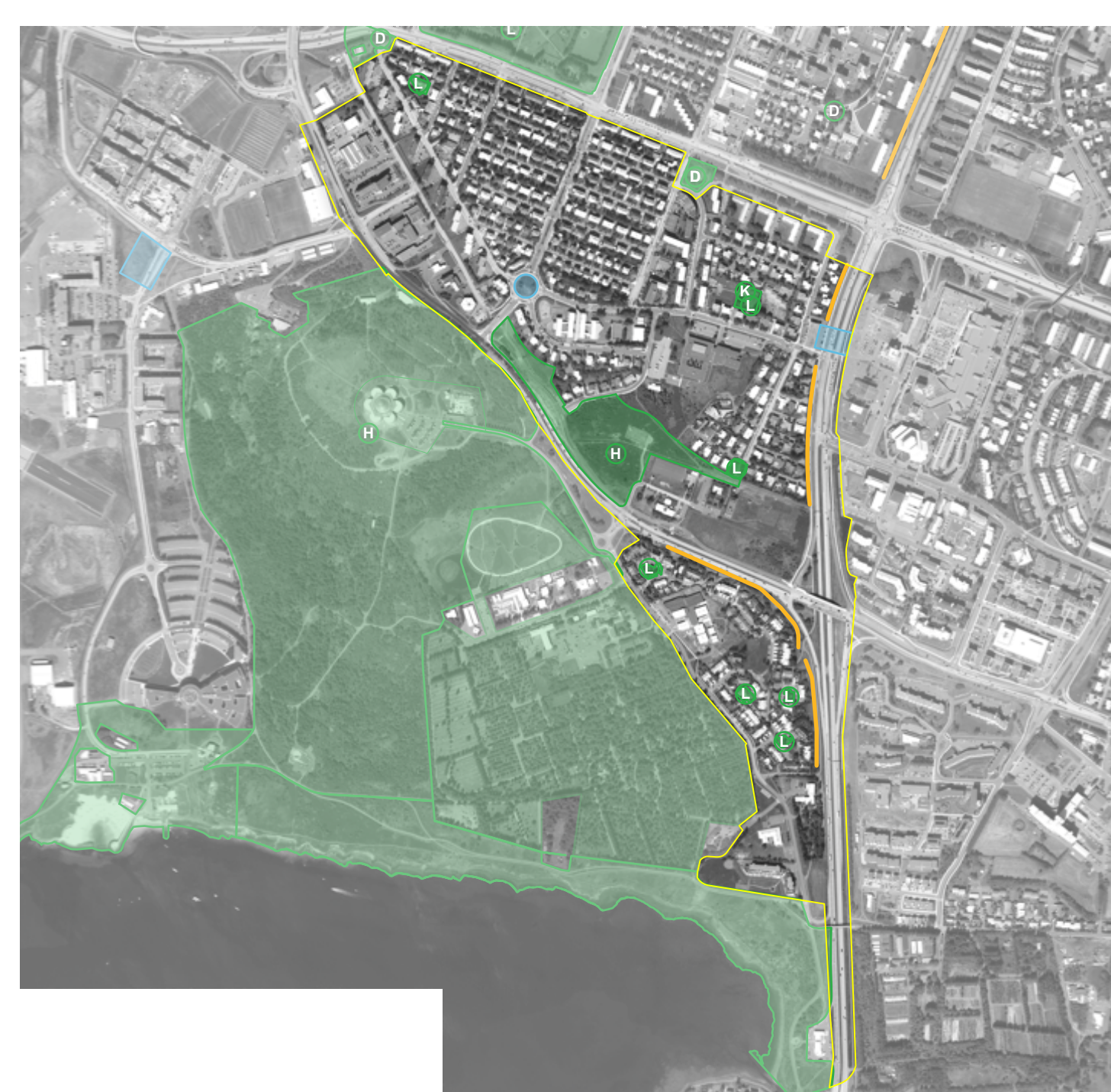
Gæði byggðar - Aerial map showing quality of building and infrastructure.

Stærri er að þróun byggðar vistvænnar forsendum með því að innleiða nýja skilmála sem eru eftirfarandi: Hlíðahverfið er að byggja upp nýja atvinnuæðisvæði, sem mun auka framboð verslunar og þjónustu hverfis.