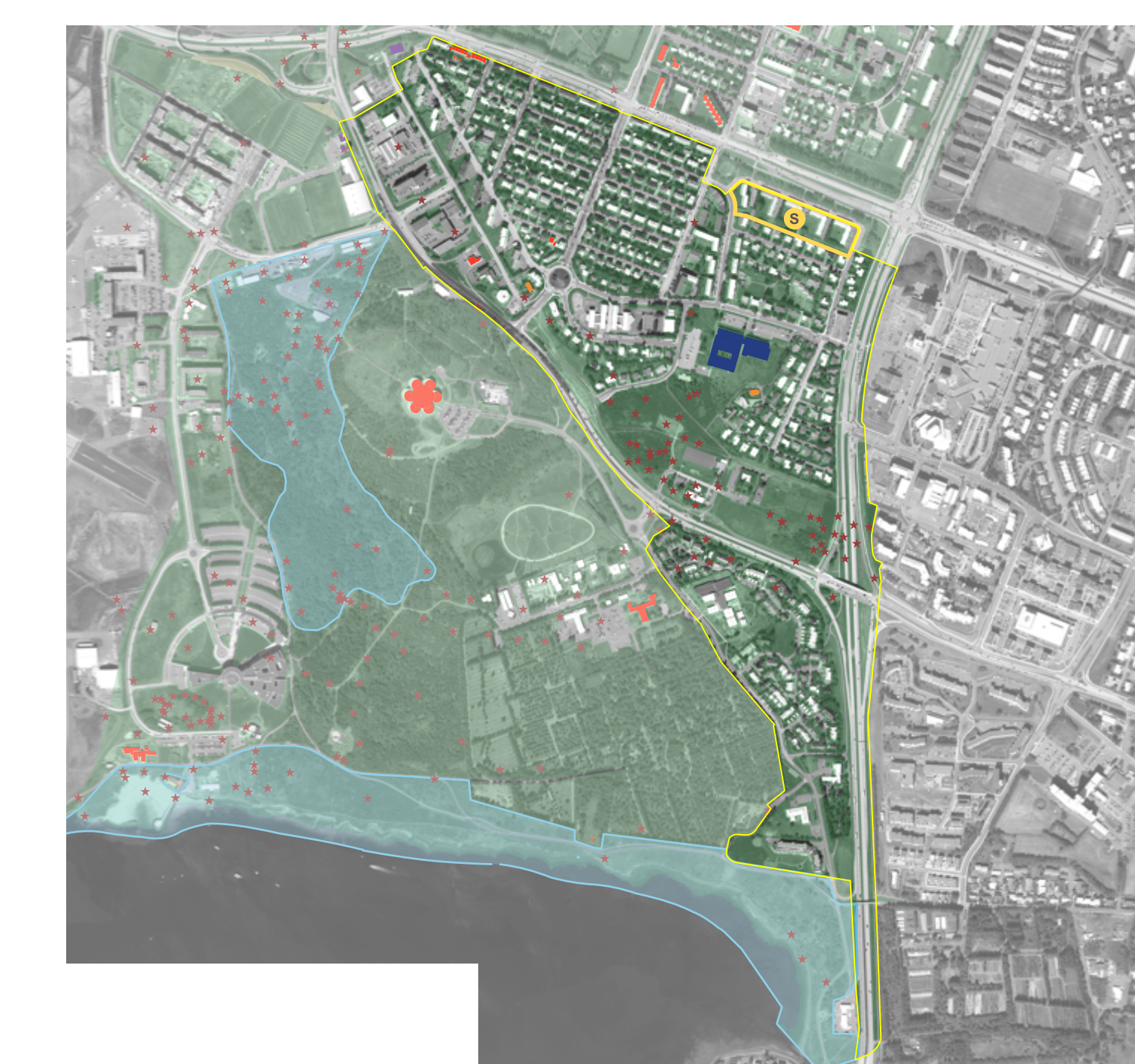
Vistkerfi og minjar - Aerial map showing the landscape and heritage zones.

Stærri er að þjónu áhrifum stöðublaða með hljóla og innviðum miklubrautar og staðaranda. Stærri áhersla er að þjónu áhrifum stöðublaða með hljóla og innviðum miklubrautar og staðaranda.