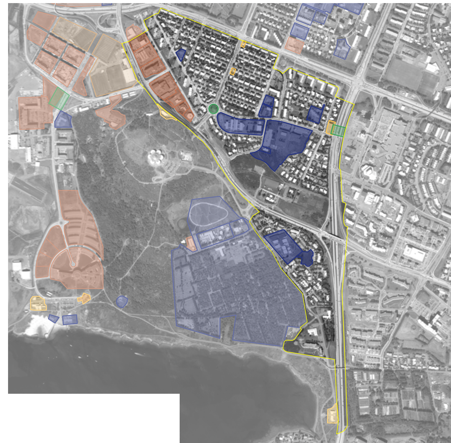
Samfélag - Aerial map showing social infrastructure and zones.

Stærri er að uppbyggingu íbúðar- og atvinnuæðisvæði á þróunarsvæðum við Skógarhlíð og Vokurastofubæ, sem mun auka framboð verslunar og þjónustu hverfis. Hvít er að þjónusta vaxandi vaxandi íbúðum. Hvít er að byggja upp nýja atvinnuæðisvæði, sem mun auka framboð verslunar og þjónustu hverfis. Hvít er að byggja upp nýja atvinnuæðisvæði, sem mun auka framboð verslunar og þjónustu hverfis.