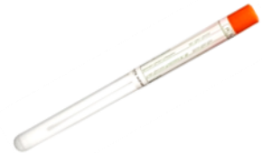
MYND 1 DNA strokpinni.

DNA sýni eru ryksýni sem eru tekin ofan af hurðarkörmum eða yfirborðsflötum þar sem ekki er þrifið að jafnaði eða reglulega. Ryki er þá safnað í strokpinna eftir leiðbeiningum frá HouseTest og síðan eru þau send til raðgreiningar hjá rannsóknarstofu þeirra í Danmörku. Í skýrslunni frá HouseTest kemur fram hvaða tegundir mátti greina í rykinu og í hvaða magni. Niðurstöðurnar frá þeim fylgja með í viðauka en hér að neðan er yfirlit yfir helstu niðurstöður.