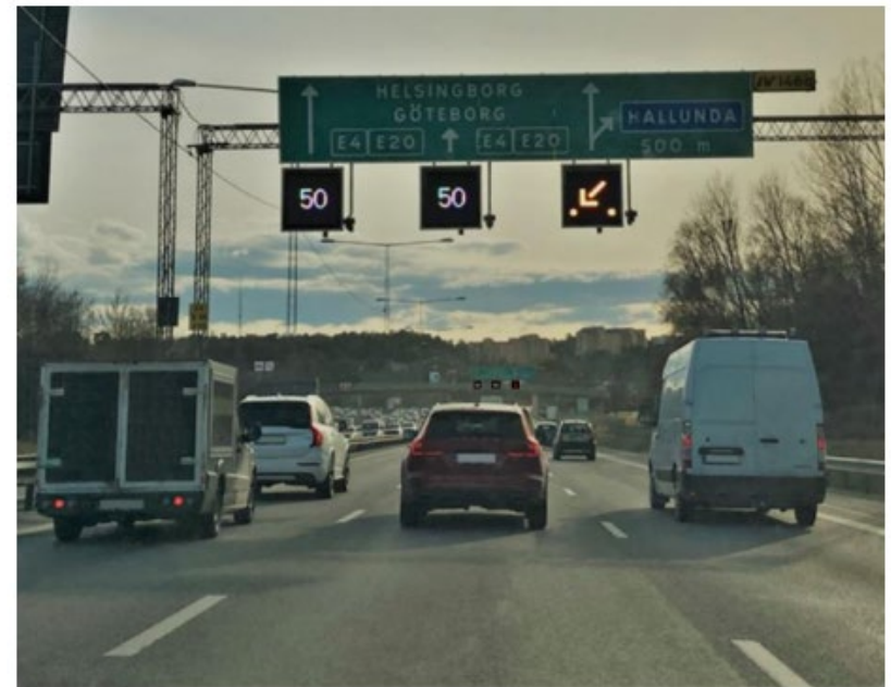
Figur 2. En vägportal som tillhör trafikledningssystemet. Rekommenderade hastigheter samt pil visas i körfältssignaler..

Miljözon är en åtgärd för att förbättra luftkvaliteten i områden.