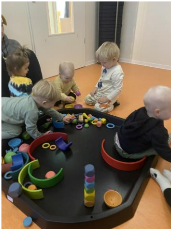
Frjáls leikur á Nauthólsvegi

Næsta skólaár munu 2018 börnin í Grandaborg ásamt fjórum starfsmönnum sameinast 2018 árgangi leikskólanum Gullborg. Við verðum áfram með aðstöðu í húsinu hjá Hagaborginni, þar verða 19 börn af Grandaborg og við fáum til okkar 12 börn frá Hagaborg. Mikil samvinna verður því áfram milli leikskólanna og stjórnendur og starfsfólk jákvætt, við sjáum fyrir okkur að aukinn stöðugleiki verði næsta skólaár en gert er ráð fyrir því að við getum snúið aftur í okkar hús Boðagrandu 9 haustið 2024.