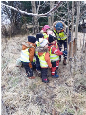
Frjáls leikur í útiveru Klettavík