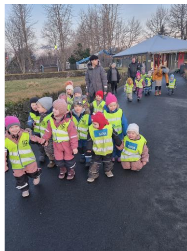
Öldu- og Skeljavík í heimsókn í vettvangsferð