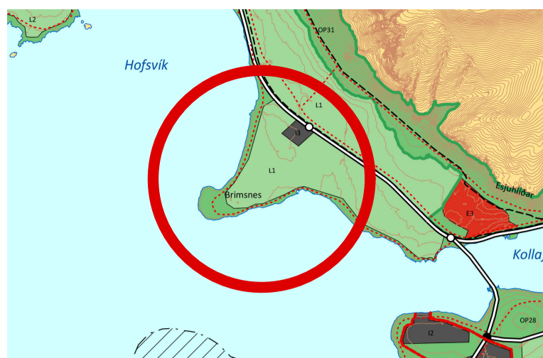
Hluti gildandi Aðalskipulags Reykjavíkur 2040