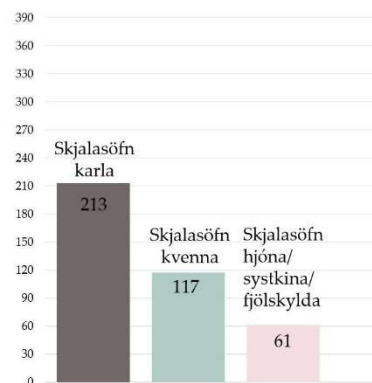
mynd 1.2 skipting skjalasafna eftir kynjum.