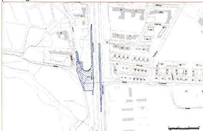
Mynd 1 Framkvæmdarsvæði

Áætlað er að verkið verði boðið út í lok sumars 2022 og að framkvæmdir geti hafist beint eftir það 2022, það er mögulegt að verkinu verði skipt upp í tvö mismunandi útboð til þess að bregðast við óheppilegri tímasetningu útboðs. Stefnt er að endanlegum verklokum haustið 2022 en ef verkið verðu boðið út í tvennu lagi mun það dragast eitthvað.