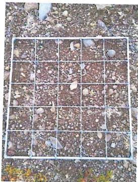
Mynd 3 sýnir talningareit staðsettan á dæmigerðum sýnatökureit (vinstri) og hvernig reitum var gefið nafn (hægri)