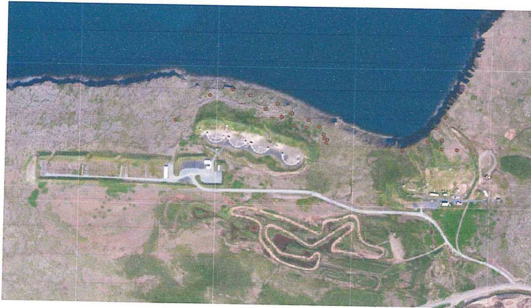
Mynd 2 er yfirlitsmynd fyrir bæði skotsvæði. Vinstra megin er skotsvæði Skotfélags Reykjavíkur og hægra megin er skotsvæði Skotveiðifélags Reykjavíkur. Sýnatökustaðir þar sem högl voru talin eru merktir með brúnum punkti.