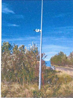
Mynd 11 sýnir SP4 hljóðmæli uppsettan við Skriðu og Stekk