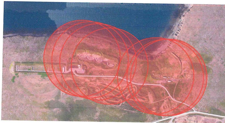
Mynd 4 sýnir drægni haglaskota ef miðað er við 250 m radius

Þegar áætlaður fjöldi hagla á fermetra (m 2 ) er skoðaður fyrir bæði svæðin sést að talsvert magn af höglum er að finna í jarðveginum við skotsvæðin en það var ekki óviðbúið. Greinilegur munur er á áætluðum fjölda hagla á fermetra (m 2 ) milli skotsvæða. Rétt er að taka fram að aðstæður eru mismunandi milli skotsvæða og er að jarðvegsmön sem er við skotvöll Skotfélags Reykjavíkur (SR) taki stóran hluta af höglum sem þaðan berst. Við skotsvæði Skotveiðifélags Reykjavíkur (Skotreyrn) er engin slík jarðvegsmön og sýnatökustaðir í beinni sjónlínu við skotsvæðið.