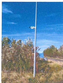
Mynd 11 sýnir SP4 hljóðmæli uppsettan við Skriðu og Stekk