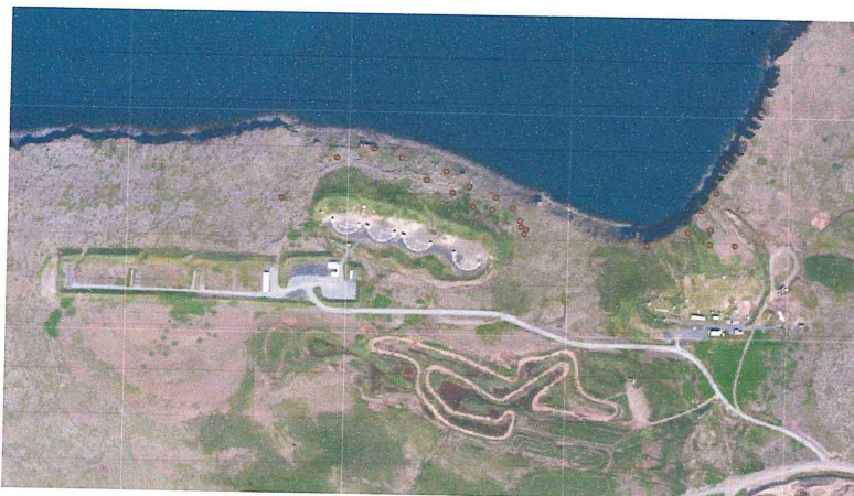
Mynd 2 er yfirlitsmynd fyrir bæði skotsvæði. Vinstra megin er skotsvæði Skotfélags Reykjavíkur og hægra megin er skotsvæði Skotveiðifélags Reykjavíkur. Sýnatökustaðir þar sem högl voru talin eru merktir með brúnum punkti.