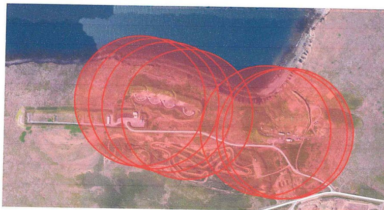
Mynd 4 sýnir drægni haglaskota ef miðað er við 250 m radíus

Þegar áætlaður fjöldi hagla á fermetra (m 2 ) er skoðaður fyrir bæði svæðin sést að talsvert magn af höglum er að finna í jarðveginum við skotsvæðin en það var ekki óviðbúið. Greinilegur munur er á áætluðum fjölda hagla á fermetra (m 2 ) milli skotsvæða. Rétt er að taka fram að aðstæður eru mismunandi milli skotsvæða og er að jarðvegsmön sem er við skotvöll Skotfélags Reykjavíkur (SR) taki stóran hluta af höglum sem þaðan berst. Við skotsvæði Skotveiðifélags Reykjavíkur (Skotreyrn) er engin slík jarðvegsmön og sýnatökustaðir í beinni sjónlínu við skotsvæðið.