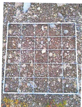
Mynd 3 sýnir talningareit staðsettan á dæmigerðum sýnatökureit (vinstri) og hvernig reitum var gefið nafn (hægri)