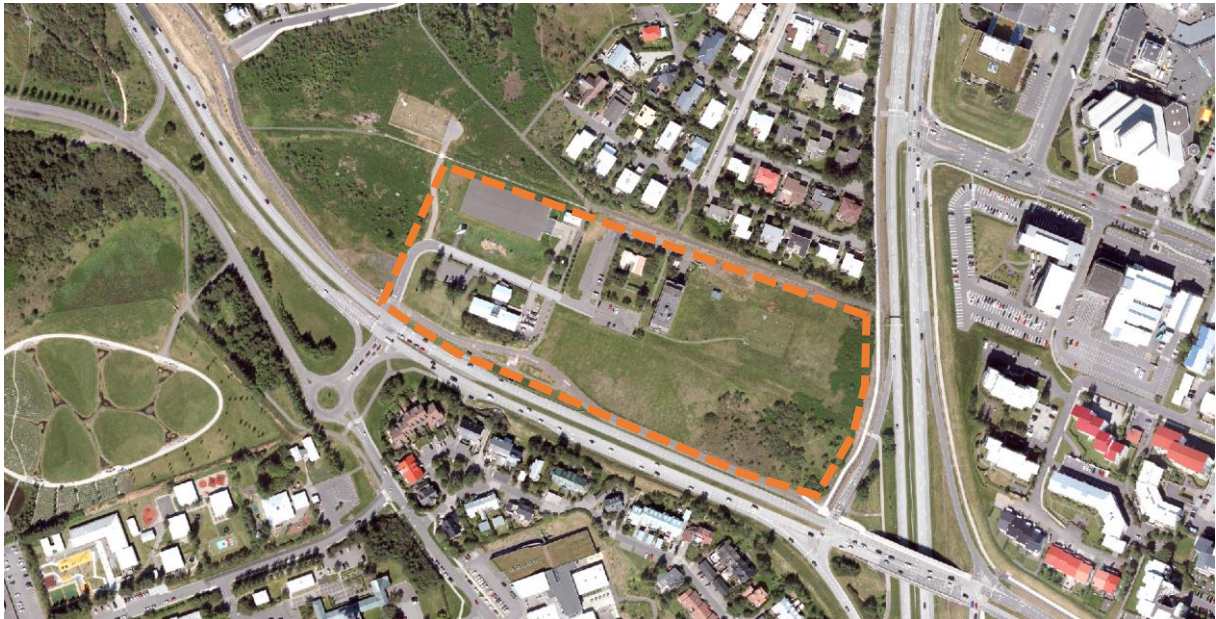
Skipulagssvæðið, yfirlitsmynd afmörkunar við Bústaðaveg, Stigahlíð, Kringlumýrarbraut og austurmörk Litlu Öskjuhlíðar

Deiliskipulagssvæðið afmarkast af Kringlumýrarbraut til austurs, Bústaðavegi til suðurs, núverandi íbúabyggð við Stigahlíð til norðurs og Háuhlíð til vesturs um opið svæði í Litlu Öskjuhlíð.