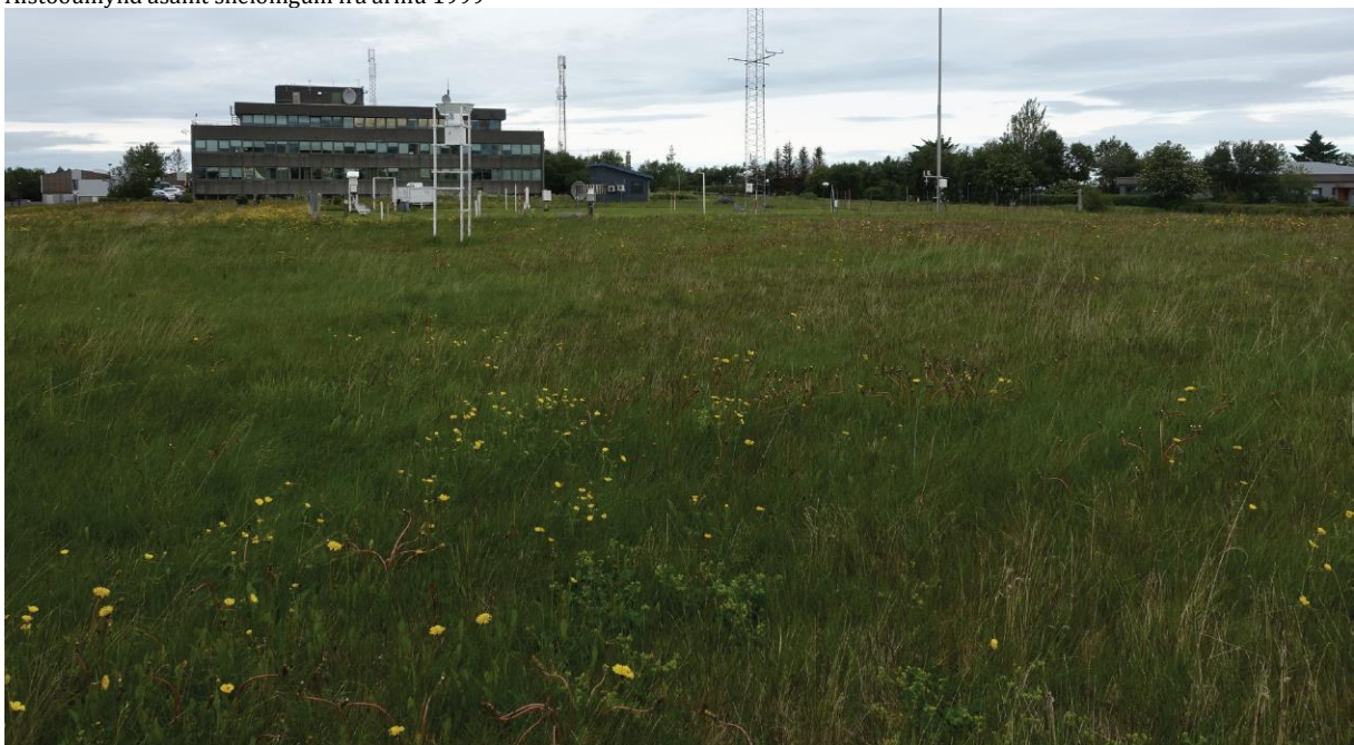
Horft til vesturs að Veðurstofuhúsi, veðurmælasvæði um miðbik og íbúðarhús við Stigahlíð til hægri