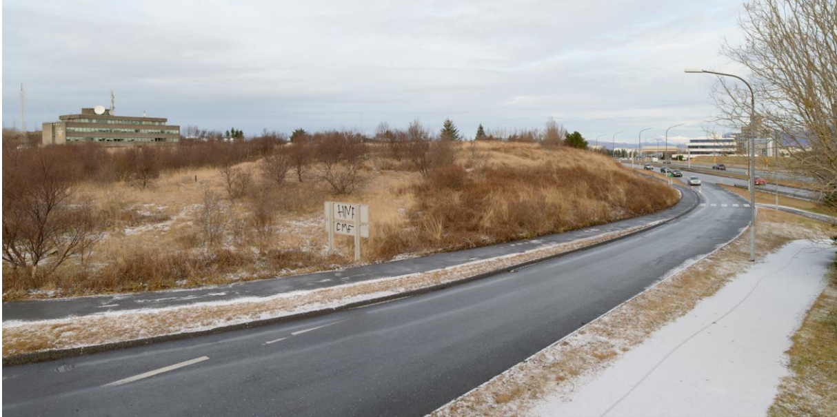
Veðurstofuhæð séð frá Öskjuhlíð (forsíða) og af frárein Kringlumýrarbrautar að Bústaðavegi (að ofan)