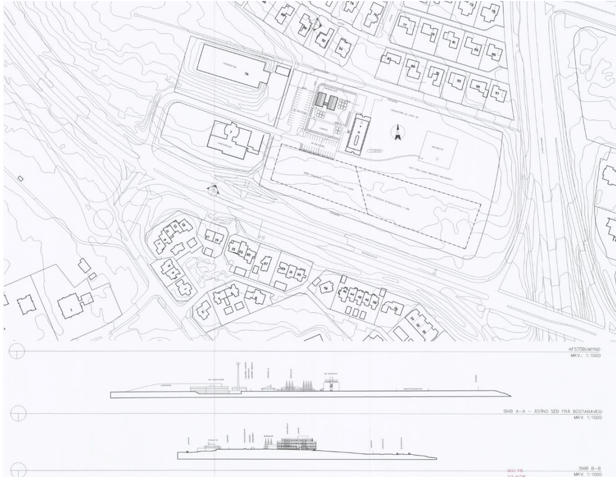
Afstöðumynd ásamt sneiðingum frá árinu 1999

Ekki liggur fyrir lögformlegt deiliskipulag að svæðinu en samkvæmt afstöðumynd frá árinu 1999 fyrir lóð Veðurstofunnar og umhverfi er byggingarreitur á sunnanverðri lóðinni um 8000m 2 að stærð, 1 – 2,5 hæðir. Þar er einnig samþykkt bygging bráðabirgðahúsnæðis vestan aðalbyggingar til ákveðins árafjölda.