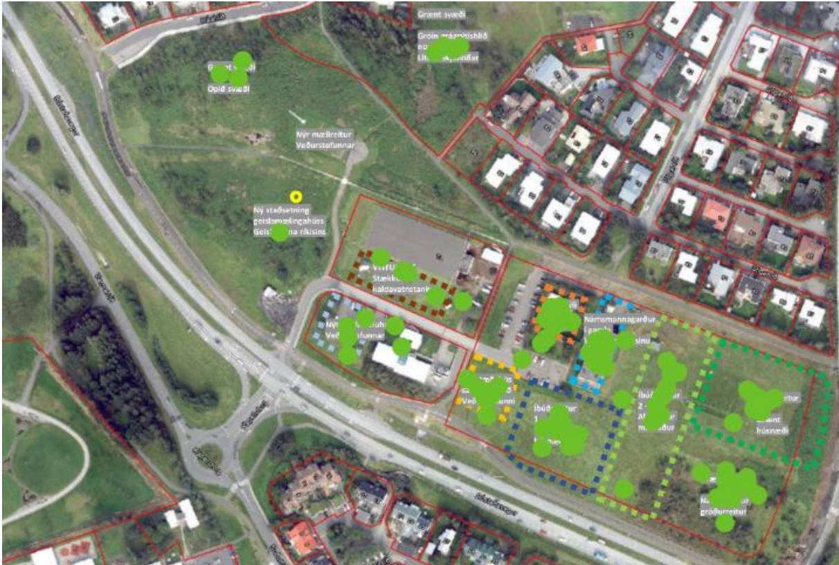
Almenningur gat merkt inn á kortið þá staði vakti athygli og skrifað athugasemdir