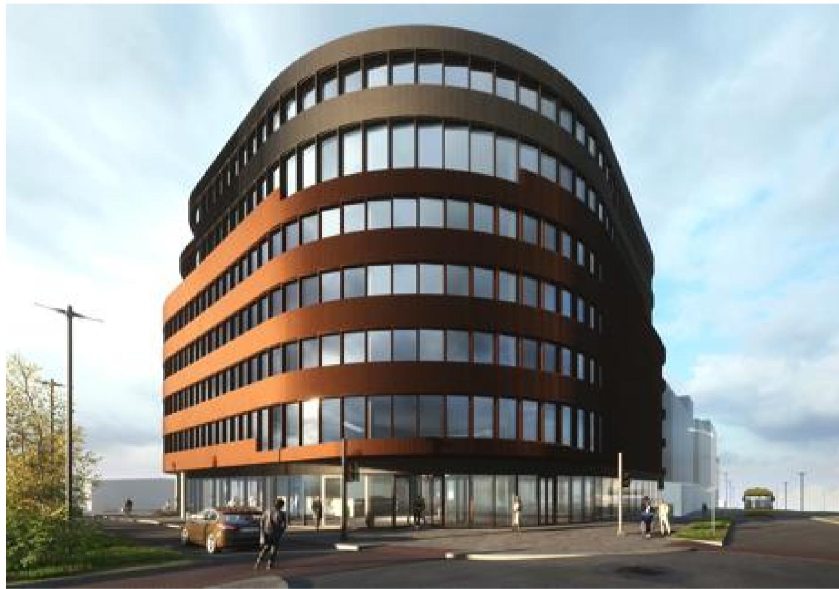
Frá horni Bildshöfða og Höfðabakka