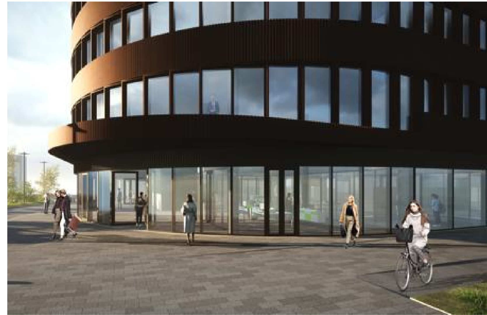
Aðalinnangangur á horni Höfðabakka