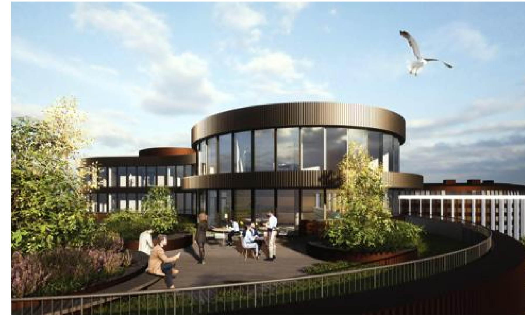
Dvalarsvæði á þakgarði