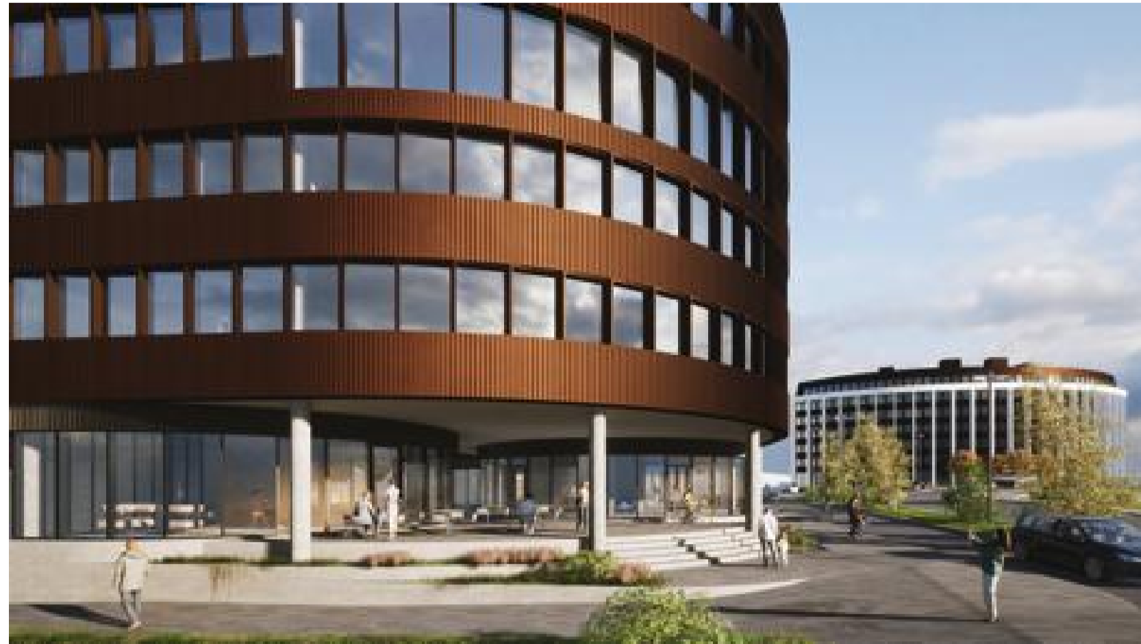
Dvalarsvæði á horni Vagnhöfða og Bildshöfða