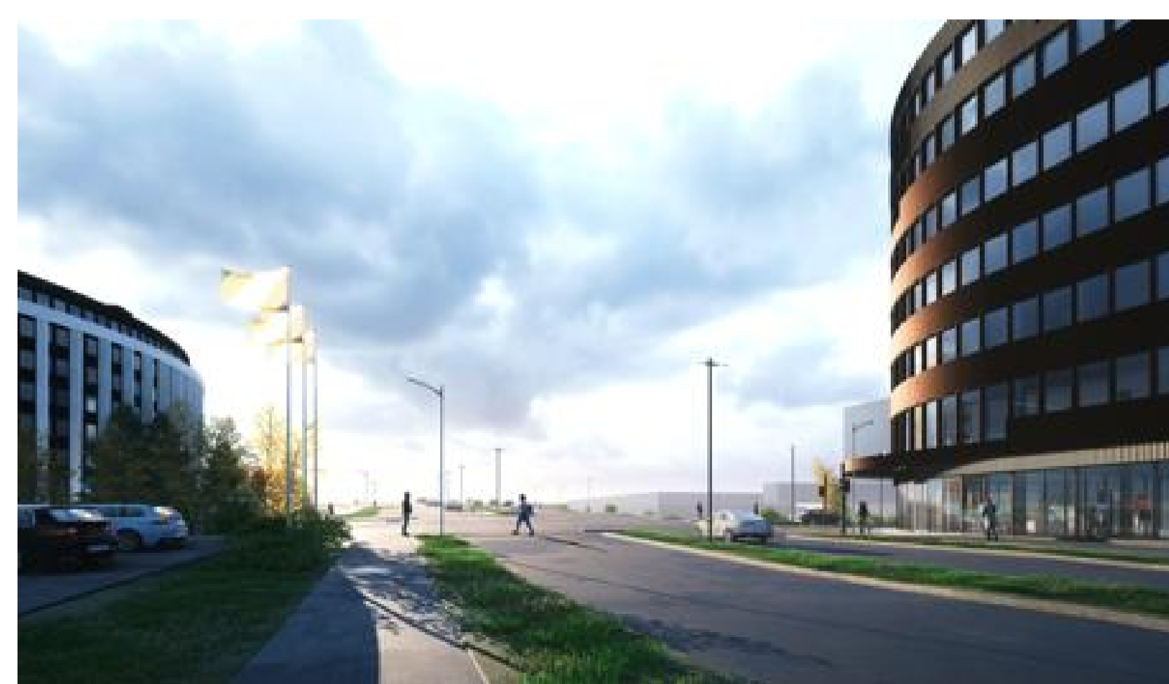
Höfðabakki til suðurs