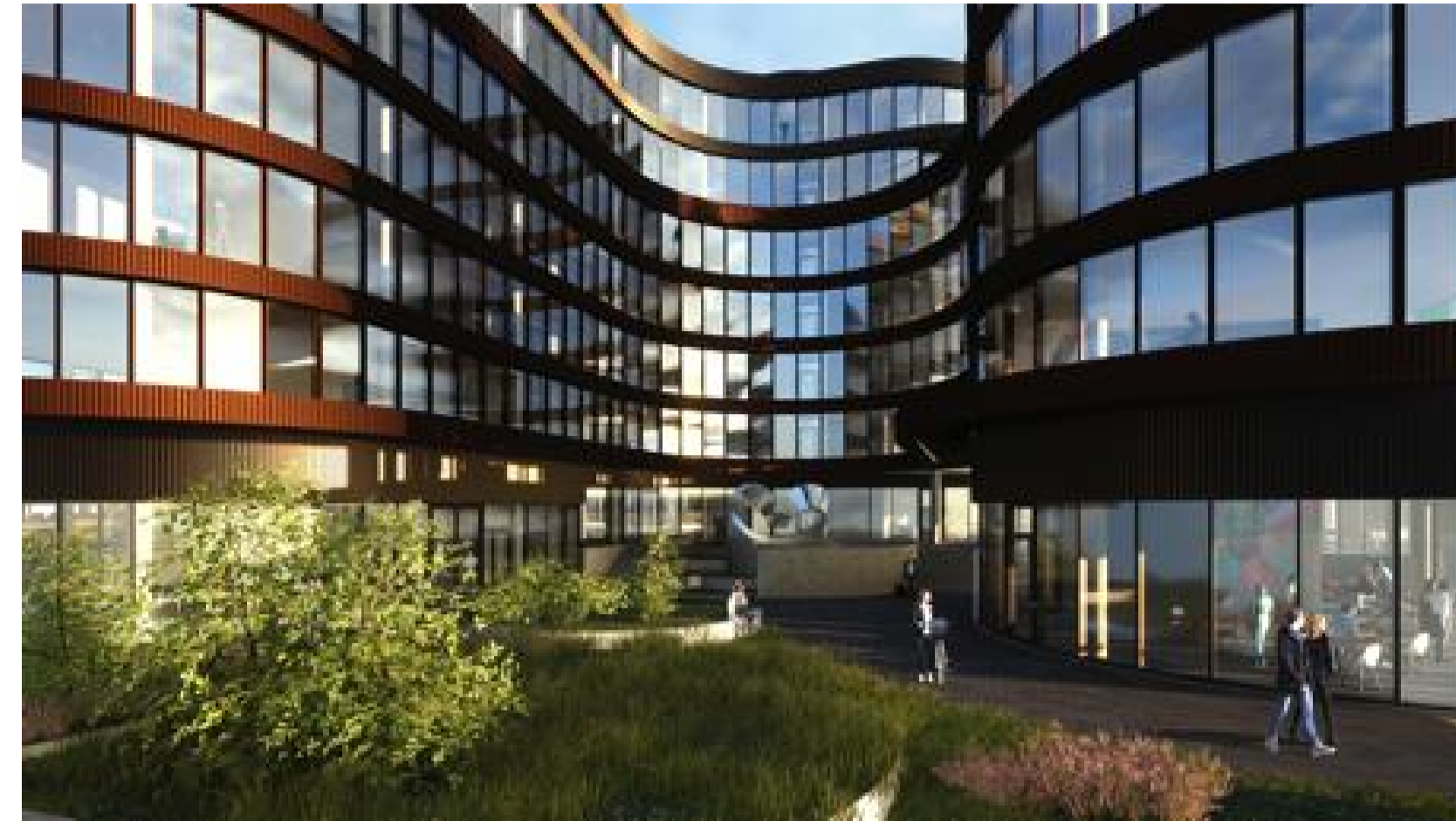
Kyrrðarsvæði í inngarði