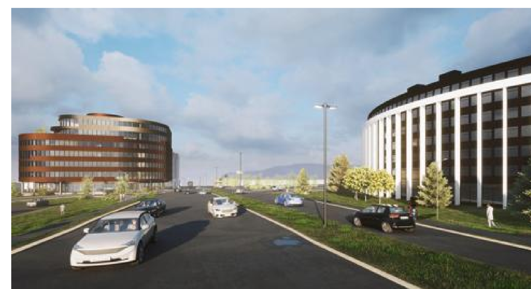
Höfðabakki til norðurs