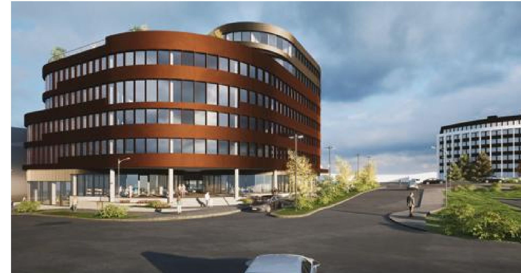
Frá horni Bildshöfða og Vagnhöfða að Höfðabakka