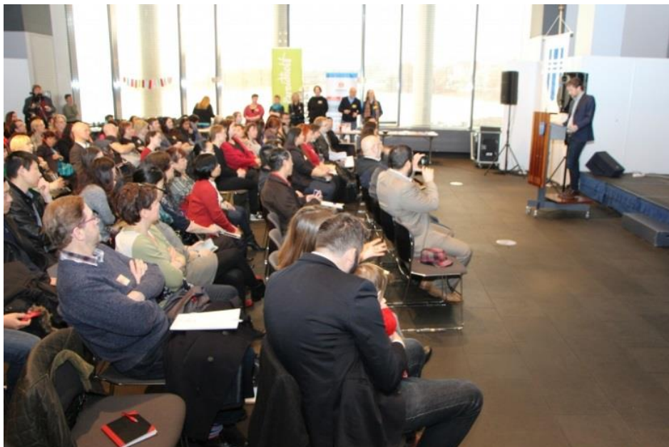
Frá setningu fjölmenningarþings, Dagur B. Eggertsson borgarstjóri ávarpar þingfulltrúa

Niðurstöður fyrri þinga hafa verið kynntar opinberlega fyrir almennum borgurum og fyrir ráðum og nefndum Reykjavíkurborgar, og hafa nýst við stefnumótum og við að bæta þjónustu við innflytjendur í borginni. Nálgastr má niðurstöðurnar á vefsíðu mannréttindaskrifstofu www.reykjavik.is/mannrettindi undir flokknum útgefið efni.