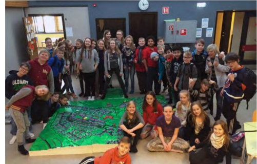
Myndir frá samráðsferli hverfisskipulags, 2015 til 2020.