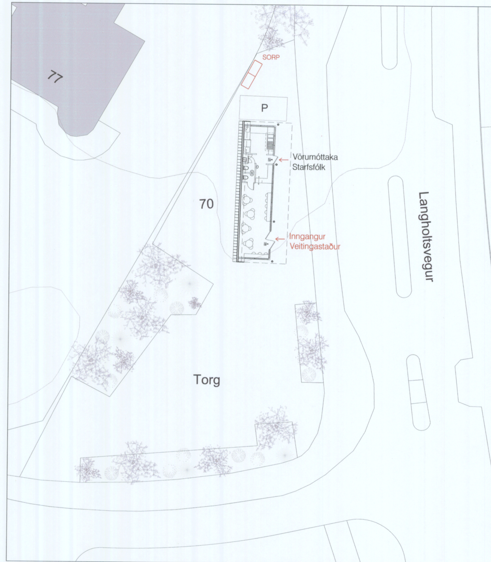
AFSTÖÐUMYND - EFTIR SPEGLUN