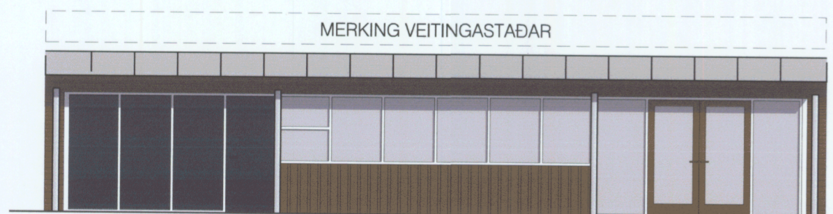
ÚTLIT - ÁN SPEGLUNAR