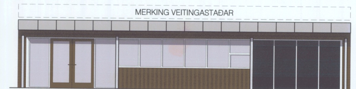
ÚTLIT - EFTIR SPEGLUN

Samþykkt af byggingarfulltrúa með skilyrði