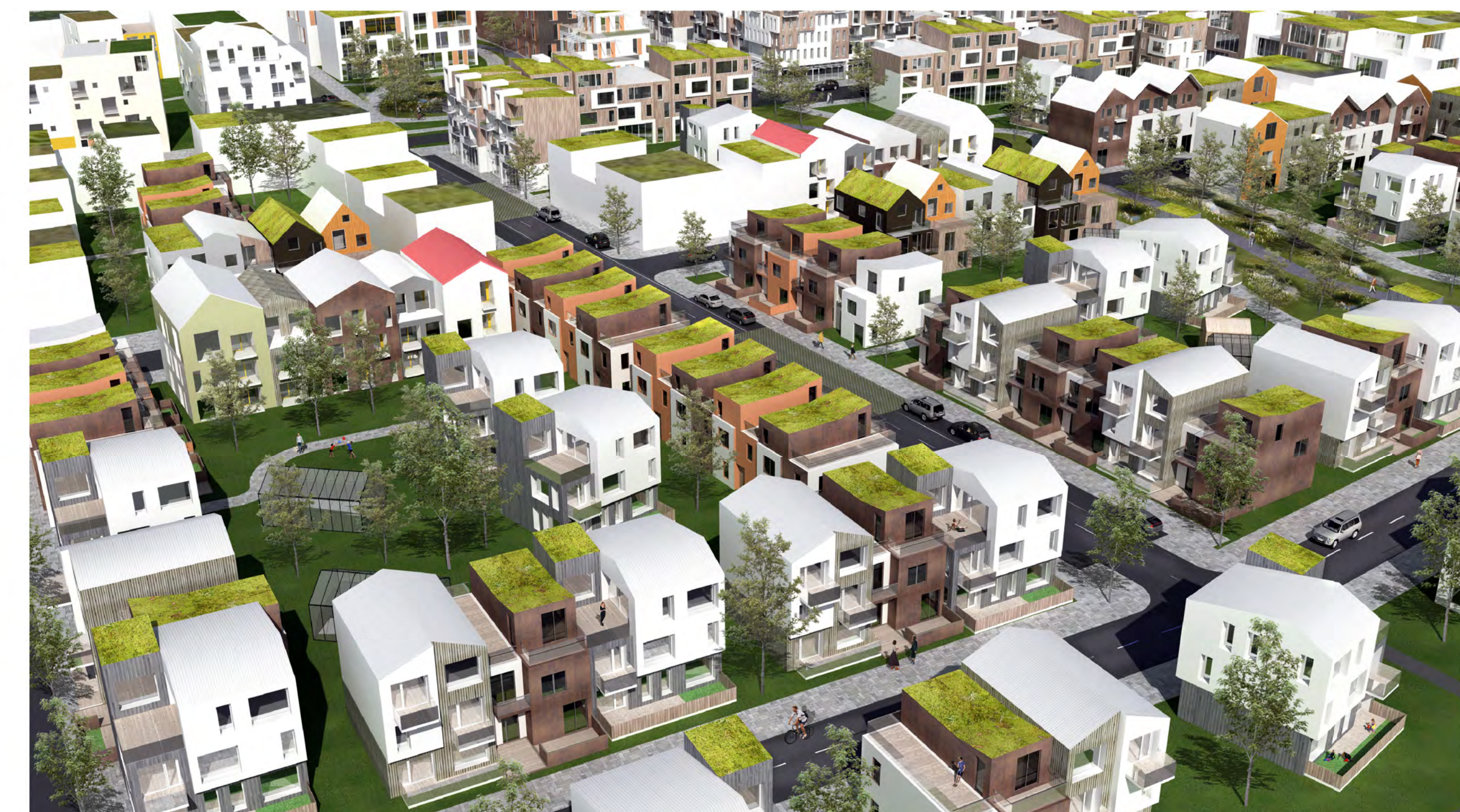
Randbyggð með húsum í inngörðum

ASK ARKITEKTAR ehf. GOSKÓGATA 100, 101 REYKJAVÍK SÍM: 515 5200 FAX: 515 5219 WWW.ASK.IS