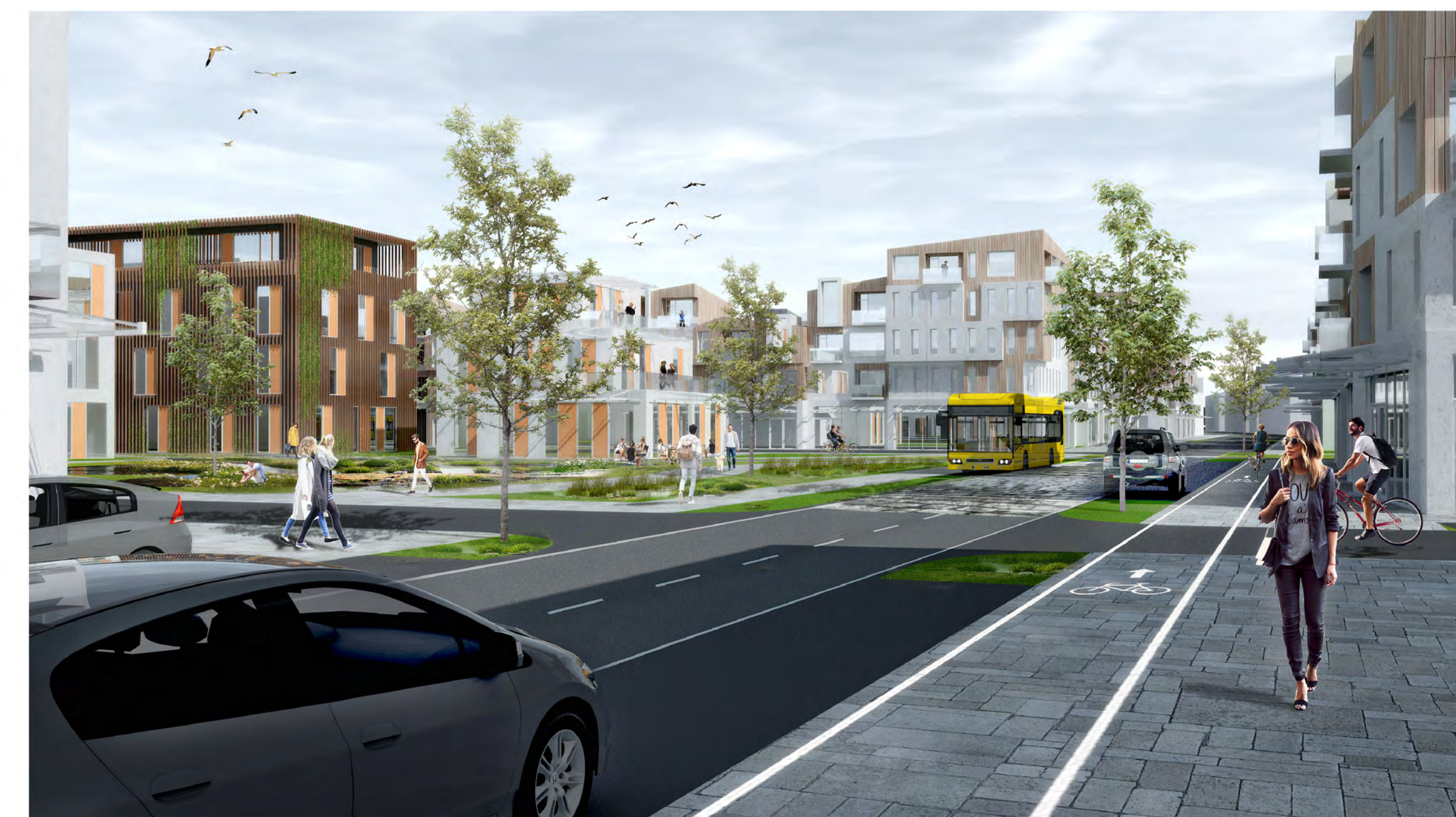
Torg og borgargata