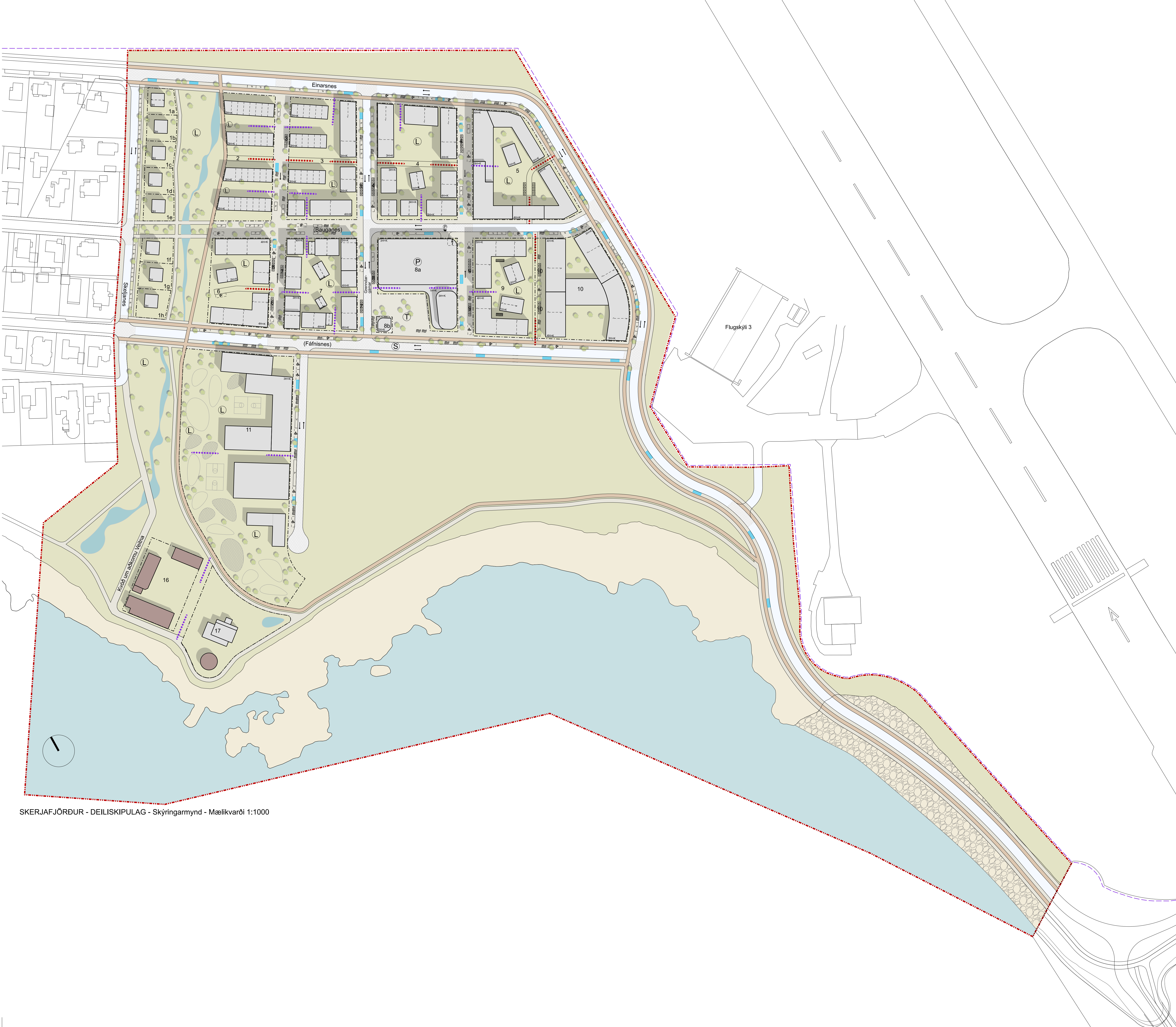
SKERJAFJÖRDUR - DEILISKIPULAG - Skýringarmynd - Mælikvarði 1:1000

Áfangi 1, reitir 1-12 og 16-17. STGR. 0-1-1668, 0-1-1680