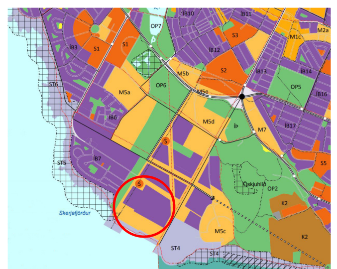
Aðalskipulag Reykjavíkur 2010-2030