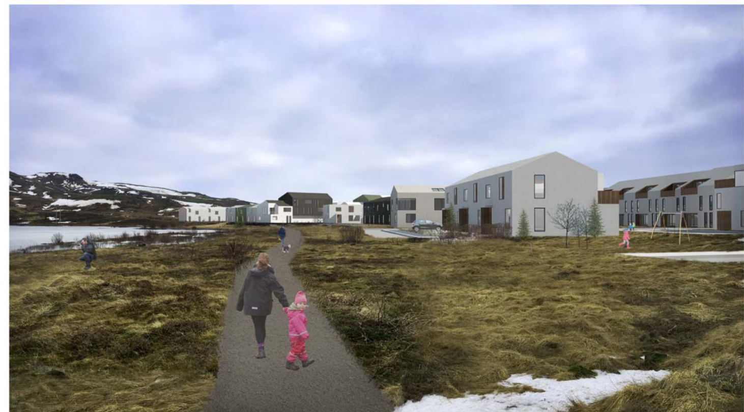
HUGMYND AD NÝRRI ÍBÚÐABYGGÐ OG ÚTIVISTARSVÆÐI VIÐ LEIRTJÖRN