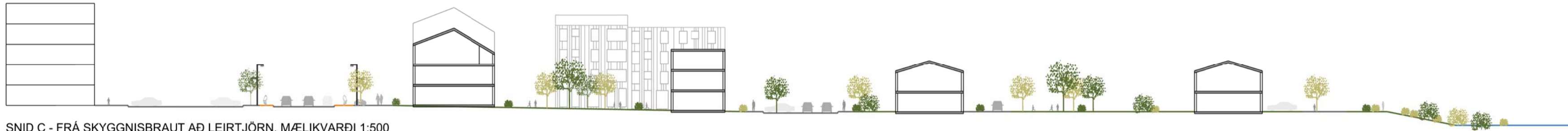
SNID C - FRÁ SKYGGNISBRAUT AD LEIRTJÖRN, MÆLIKVARÐI 1:500