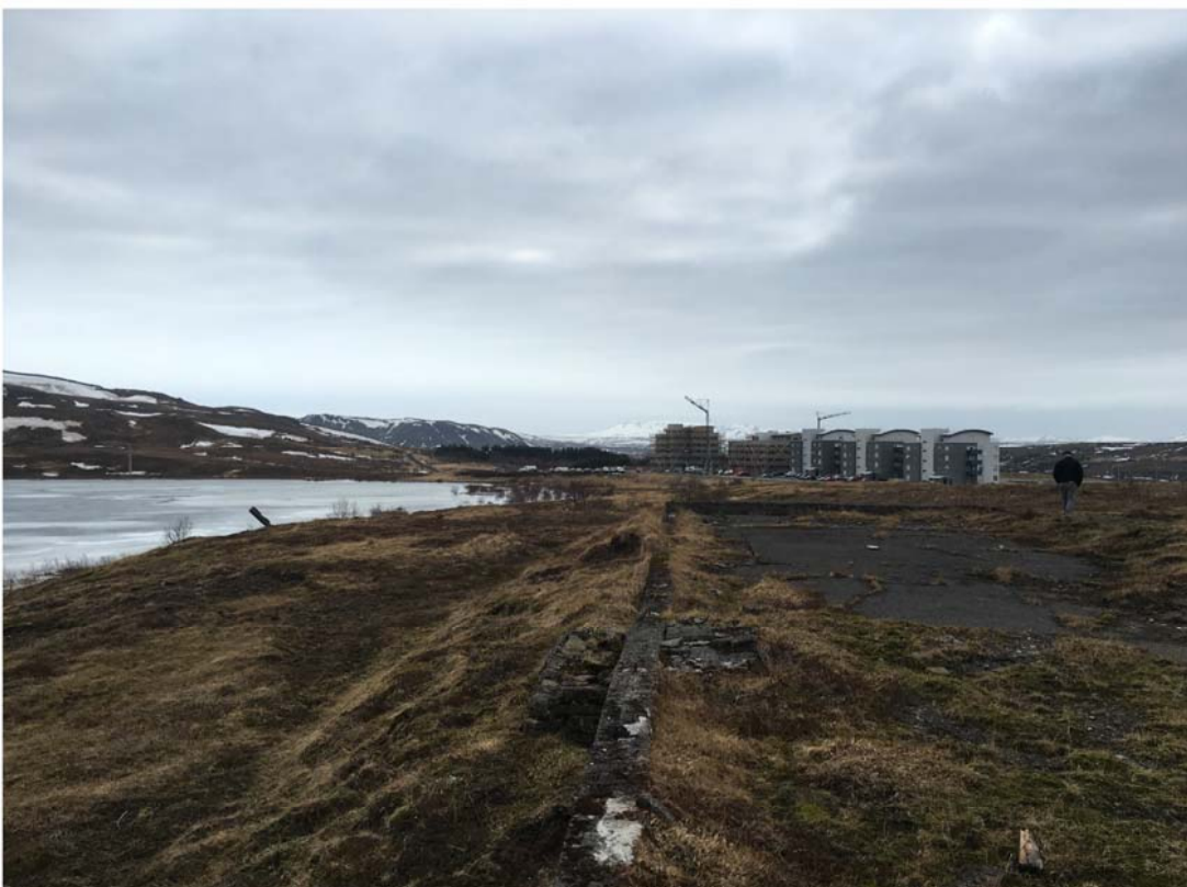
LEIRTJÖRN Í DAG