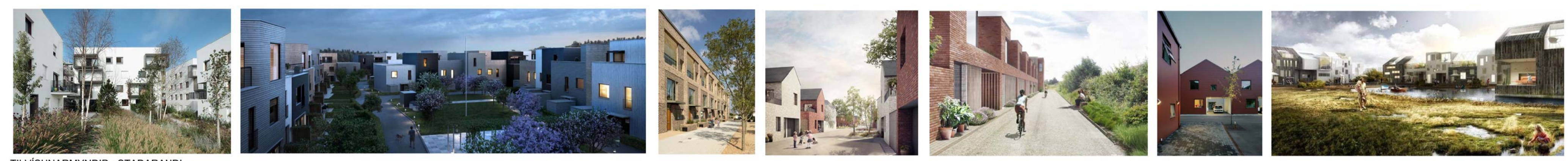
TILVÍSUNARMYNDIR - STAÐARANDI