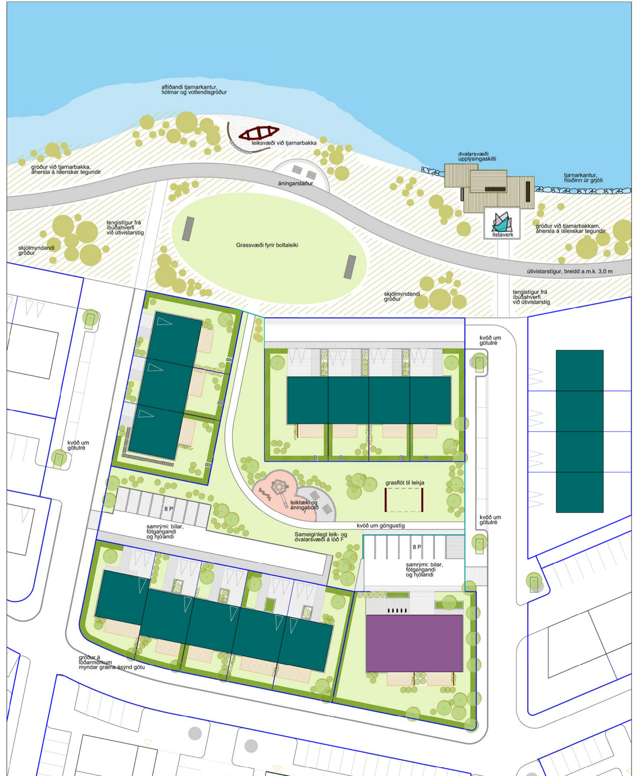
SKÝRINGARMYND AF REIT F, SÝNIR MÖGULEIKA Á LÖÐ. STAÐSETNINGU GRÓÐURS LEIDBEINANDI. SÝNIR EINNIG LEIKSVÆÐI VIÐ LEIRTJÖRN, MÆLIKVARÐI 1:500