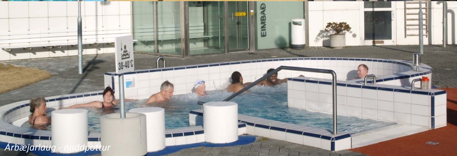
Arbæjarlaug - nuddpottur