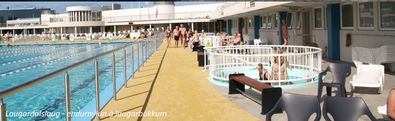
Laugardalslaug - endurnýjun á laugarbökkum