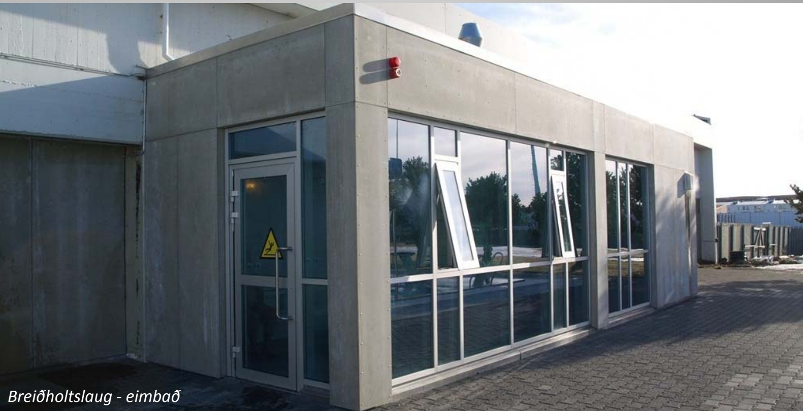
Breiðholtslaug - eimbað