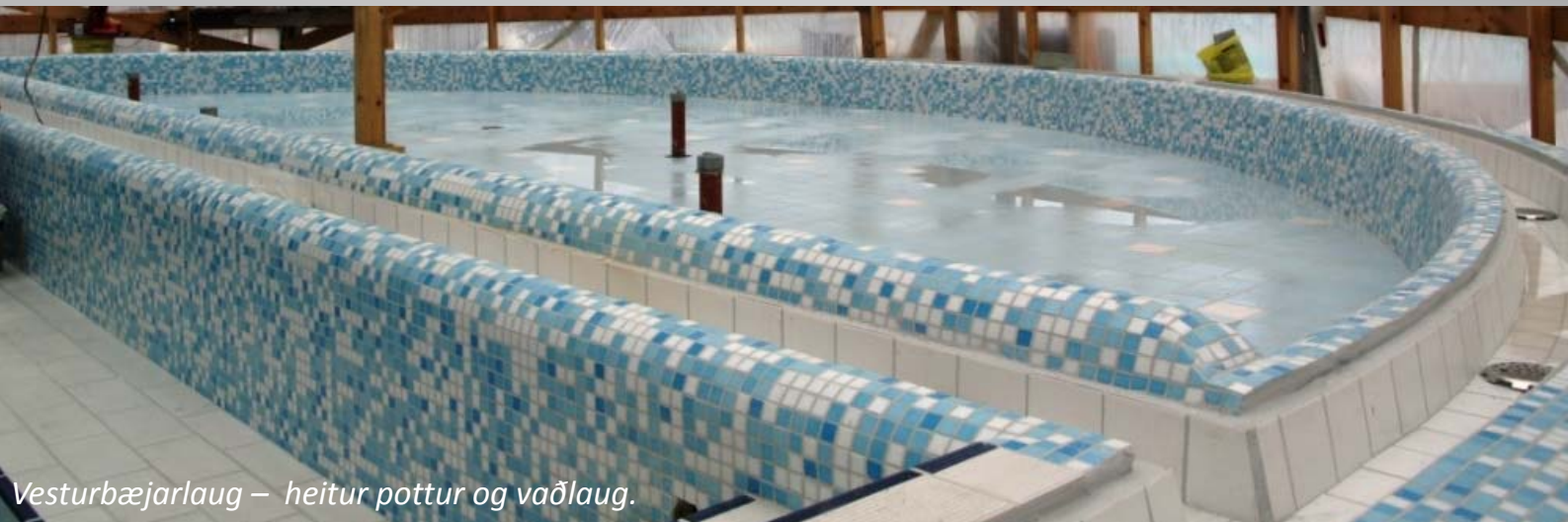
Vesturbæjarlaug – heitur pottur og vaðlaug.