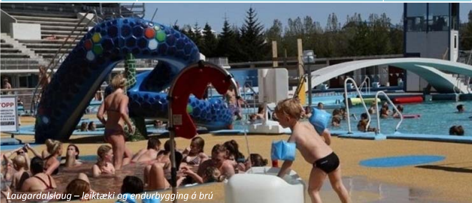
Laugardalslaug – leiktæki og endurbygging á brú