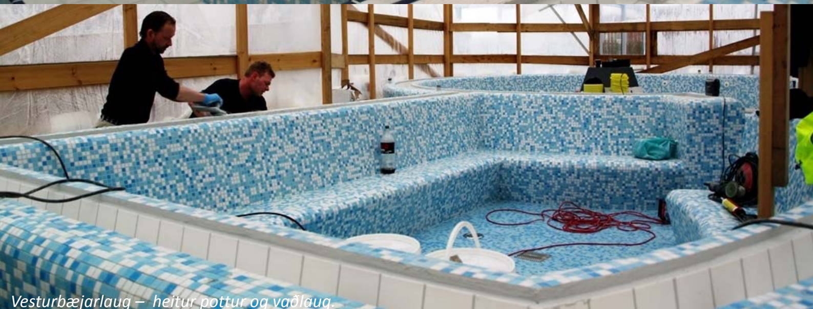
Vesturbæjarlaug – heitur pottur og vaðlaug.