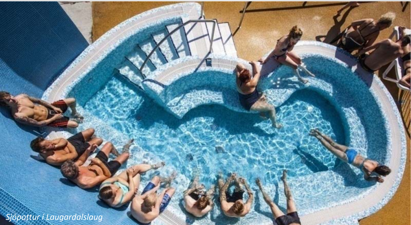
Sjópottur í Laugardalslaug