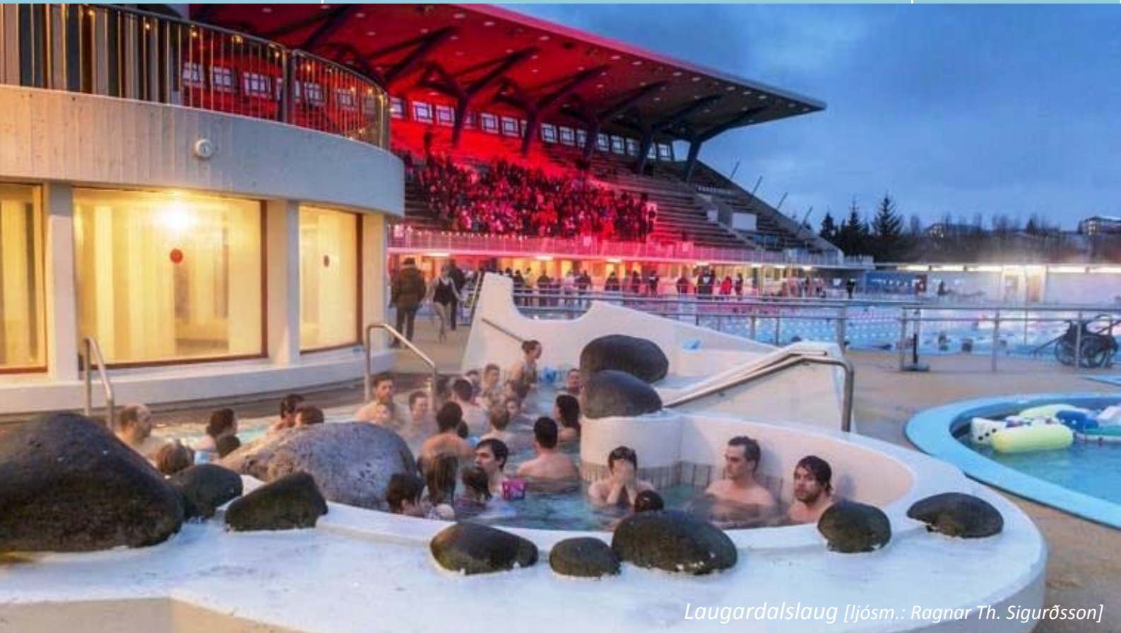
Laugardalslaug [ljósm.: Ragnar Th. Sigurðsson]