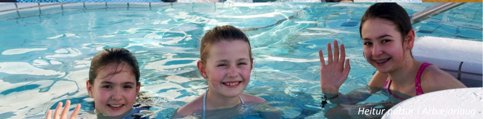
Heitur pottur í Arbæjarlaug