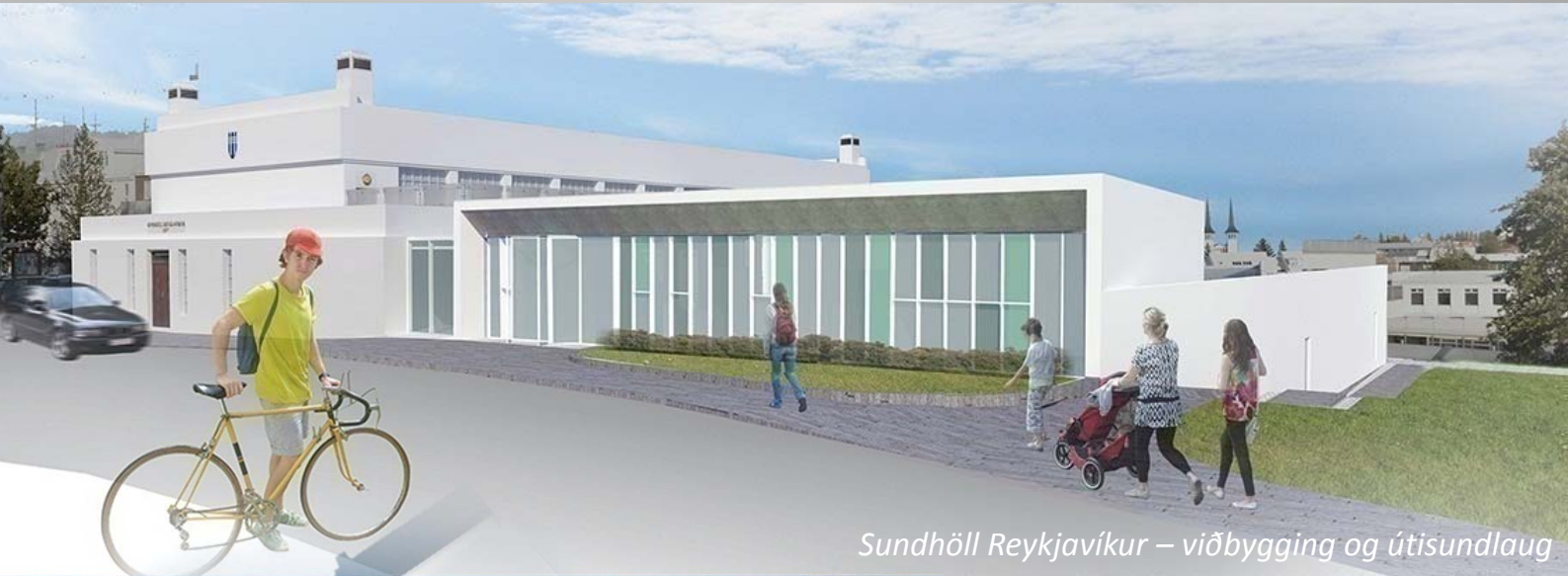
Sundhöll Reykjavíkur – viðbygging og útisundlaug