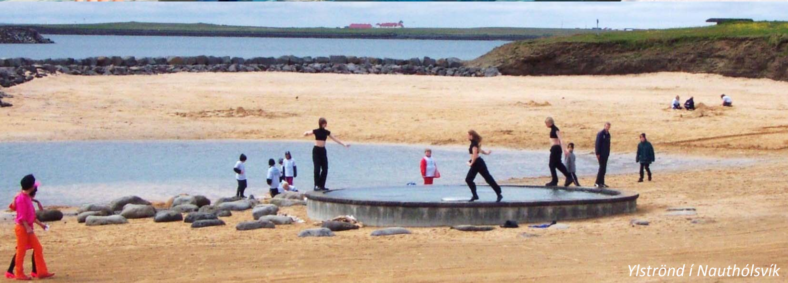
Ylströnd í Nauthólsvík