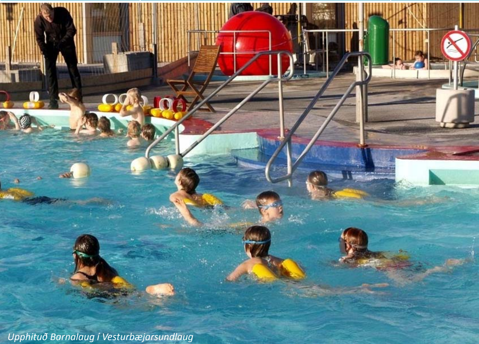
Upphitað Barnalaug í Vesturbæjarsundlaug