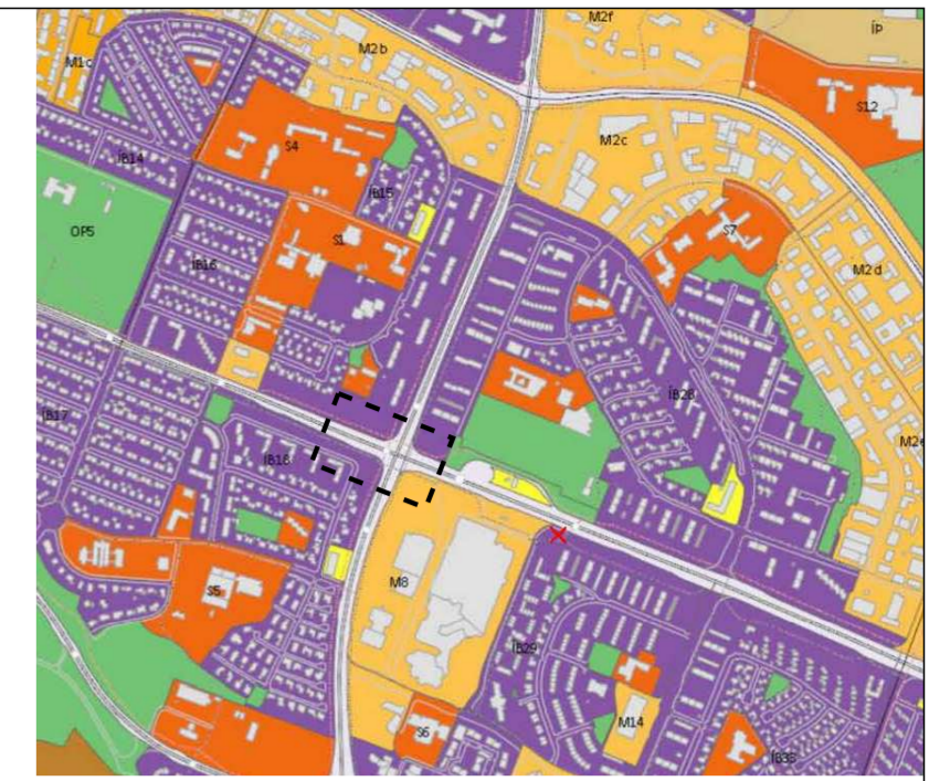
HLUTI GILDANDI AÐALSKIPULAGS 2010-2030

Að öðru leyti verður deiliskipulag Miklubrautar óbreytt.