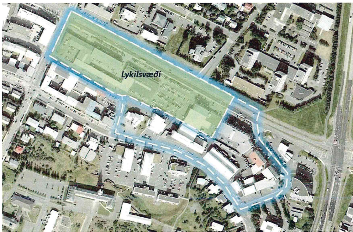
Mynd 1. Afmörkun samkeppnissvæðis

Skipulagssvæðið afmarkast af Nóatúni til vesturs, Brautarholt og Skipholti til suðurs, Bolholti til austurs og Laugavegi til norðurs. Skipulagsmörkin við Laugaveg eru yfir alla götuna þar sem huga þarf að framtíðarlegu Borgarlínu um svæðið og mögulegri uppbyggingu meðfram götu sunnan og norðan til. Skipulagssvæðið er alls um 6 hektarar að stærð. Lykiláhersla er lögð á þróun og uppbyggingu meðfram samgöngu- og þróunarásnum við Laugaveg 168-176.