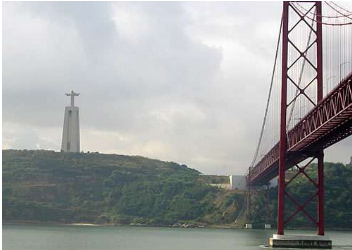
SASA hópurinn, 2010