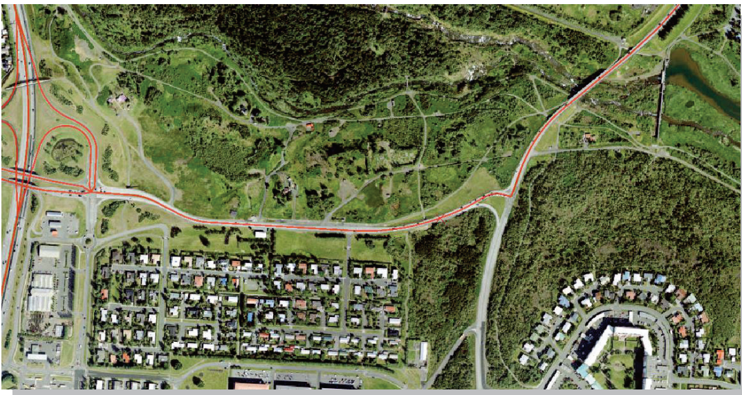
Loftmynd af svæðinu í dag.

Hugmyndin um BioDome Reykjavík, "Sjálfbær gróðurhús í hjarta borgarinnar" byggir á þyrpingu 3-4 gróðurhvelvinga sem samhverfast um stærri kjarna (almenning/torg) og mynda eina heild. Áhersla er lögð á vistvænt nærlandi umhverfi, upplifun og sterkan staðaranda. Hvelvingarnar eru græn lungu; vin frá hinu hversdagslega amstri og hvert þeirra hefur sínu hlutverki að gegna. Stærsta einingin geymir fjölnota torg; iðandi mannlíf í frjóu trópísku umhverfi. Þar er m.a. að finna afgreiðslu og upplýsingaþjónustu, veitingastað, eldhús, snyrtingar og litla búð. Í tveimur minni hvelvinganna færi fram sameldi og ylrækt og í þeirri þriðju kennsla.