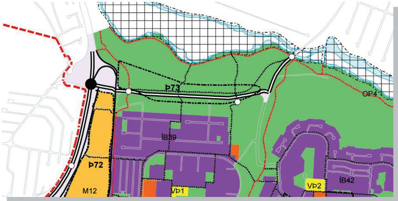
Hluti af aðalskipulagi Reykjavíkur 2010-2030.

Í aðalskipulagi Reykjavíkur 2010-2030 þá er svæðið skilgreint sem Þ73, Svæði norðan Stekkjarbakka. Um er að ræða raskað svæði í jaðri útivistarsvæðisins í Elliðaárdal. Svæði fyrir starfsemi sem hentar í nálægð útivistarsvæðisins, tengist útivist, íþróttastarfsemi eða samfélagsþjónustu. Umfang mögulegra bygginga verði takmarkað og miðist við 1-2 hæðir. Möguleg byggð hafi sem minnst sjónræn áhrif frá Elliðaárdalnum. Einnig heimilt að gera ráð fyrir “grænni starfsemi”, ræktun og gróðrarstöð. Í samantekt á umhverfismati aðalskipulagsins í B-hluta um Breiðholts þá er tekið fram að uppbygging á þróunarsvæðum Þ73 veldur raski á opnum svæðum í jaðri Elliðaárdals. Umrædd svæði eru þegar röskuð að hluta og hefur uppbygging á þessum svæðum óveruleg áhrif á útivistargildi dalsins.