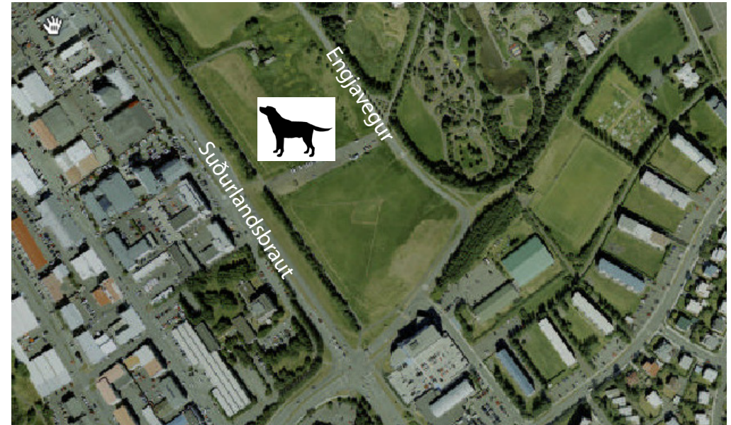
Í Laugardal sunnan við Fjölskyldu- og húsdýragarðinn.